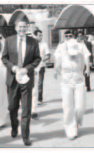
السفير الأمريكي يتفقد آخر أعمال رحلة الأمل