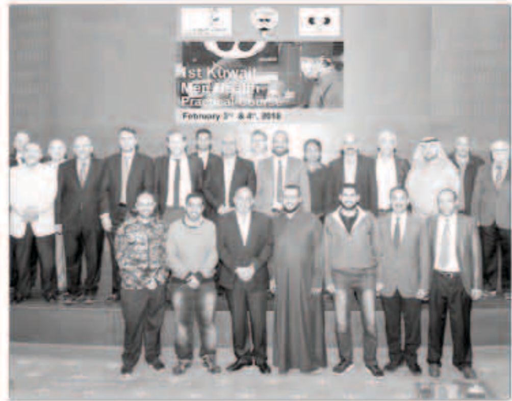
دول أوروبية. ولفت الحنيان إلى أن عمليات الأجهزة التعويضية تعد حلاً للكشف على الحالات على مدار يومين. بالإضافة إلى محاضرات وحضور أطباء من

كشف استشاري أمراض المسالك البولية والاستاذ في كلية الطب بجامعة الكويت ورئيس رابطة المسالك البولية د. عادل الحنيان عن ارتفاع معدل الضعف الجنسي بين الرجال في دولة الكويت، حيث بلغ 75% عند الذين تصل معدل أعمارهم إلى الستين عاماً فما فوق، و30% بعد سن الأربعين، و20% لدى من هم دون ذلك. وأضاف الحنيان في تصريح صحافي على هامش مؤتمر الكويت السنوي لأمراض صحة الرجل الذي بحث آخر المستجدات الطبية المتعلقة بأمراض صحة الرجل كالضعف الجنسي ومشاكل الإنجاب والعقم، كما أشار الدكتور عادل الحنيان إلى أن مشاكل الضعف الجنسي مرتبطة بالأمراض المزمنة كالسكري وأمراض القلب.