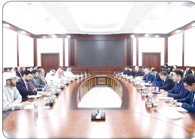
جانب من اجتماع مسؤولي دول مجلس التعاون الخليجي وآسيا الوسطى