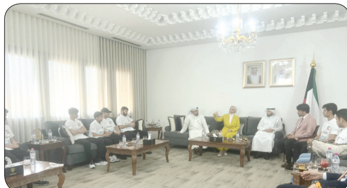
السفير العمري يستقبل رئيس وأعضاء وفد الكويت المشارك في البطولة العربية للروبوت

وتوجهت العميري بالشكر والدعم إلى السفير منصور العمري وعضو السفارة المعنوي للوفد الكويتي خلال فترة وجوده في تونس مما يعكس حرص السفارة