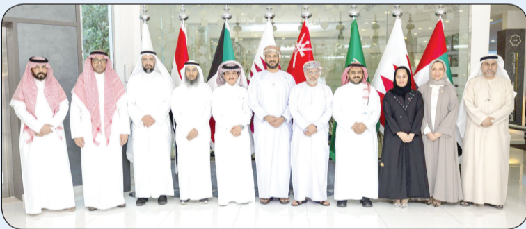
المشاركون في الاجتماع الـ 100 لمجلس الصحة الخليجي

الصحي وذلك بهدف تعزيز فاعلية النظام الصحي وتحقيق الاستفادة في الخدمات الصحية بدول مجلس التعاون الخليجي. وفي محور الوقاية وتعزيز الصحة أشار البيان إلى أن الاجتماع ناقش سبل تطوير برنامج "سلامتك" التوعوي واستعرض منجزات المركز الخليجي للوقاية من الأمراض ومكافحتها وآليات تعزيز الصحة العامة في دول الخليج. كما تطرق الاجتماع إلى برنامج "واقد" لفحص الوافدين قبل دخولهم إلى دول المجلس الذي يشرف حاليا على أكثر من 700 منشأة صحية في 30 دولة و82 مدينة حول العالم إلى جانب مناقشة خطته التوسعية. واستعرض الاجتماع عددا من المبادرات الصحية المقدمة من الدول الأعضاء وناقشها ضمن جدول الأعمال. وفي الختام أقر الاجتماع عددا من التوصيات مؤكدا حرص دول المجلس على مواصلة العمل المشترك لتعزيز الأمن الصحي والتكامل في المجال الصحي الخليجي.