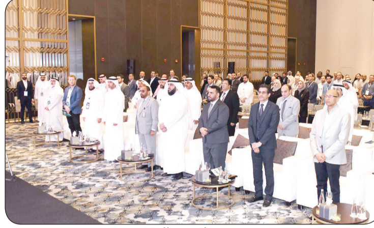
وجانب من الحضور