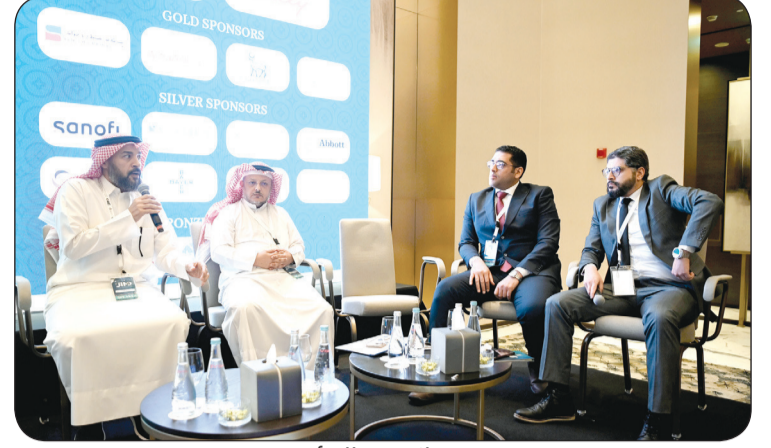
جانب من المؤتمر

المتخصصين في أمراض "الروماتيزم". وأكدت الدكتورة الهاجري أن الرابطة تواصل سعيها لتعزيز التواصل العلمي ودعم جهود الأطباء في الإطلاع على أحدث التطورات العلمية والبحثية بما يسهم في تحسين جودة الرعاية المقدمة للمرضى في الكويت والمنطقة.