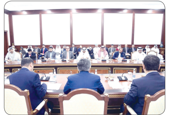
مساعد وزير الخارجية لشؤون مجلس التعاون الخليجي السفير نجيب البدر مع النائب الأول لوزير خارجية أوزبكستان بهرامجان علييف