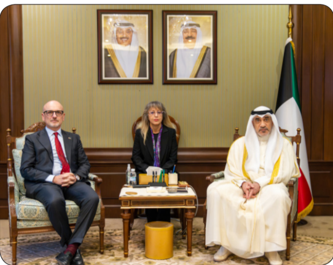
رئيس مجلس الوزراء بالإتابة مستقبلاً سفير جمهورية إيطاليا لدى البلاد