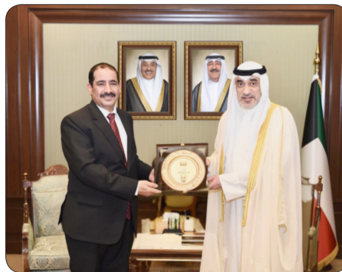
رئيس مجلس الوزراء بالإتابة مستقبلاً وزير الداخلية اليمني