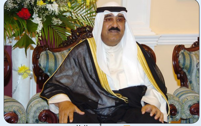
سمو أمير البلاد

والعافية ولمملكة تونغا وشعبها الأحمد ببرقية تهنئة إلى الملك توبو السادس ملك مملكة تونغا الصديقة عبر فيها سموه عن خالص تهنائه بمناسبة العيد الوطني لبلاده. رئيس مجلس الوزراء ببرقيته تهنئة متمنيا سموه له موفور الصحة