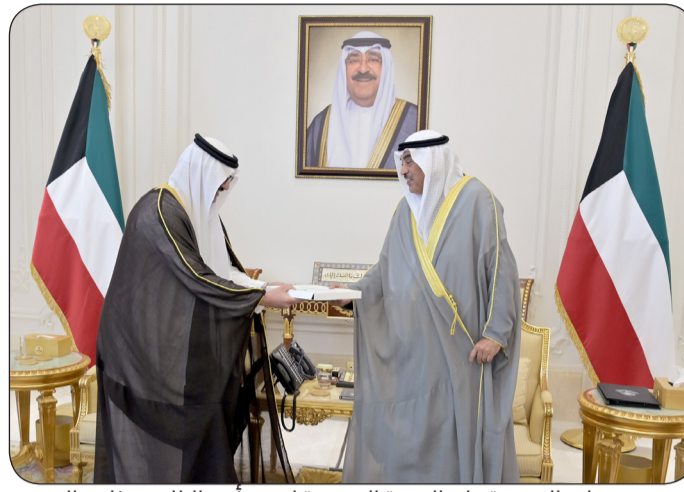
سمو ولي العهد يسلم الدعوة الموجهة لسمو أمير البلاد من خادم الحرمين

وكبار المسؤولين بالديوان الأميري وديوان سمو ولي العهد. من جهة أخرى استقبل سمو ولي العهد بقصر بيان صباح أمس الأمين العام لمجلس التعاون لدول الخليج العربية جاسم محمد البديوي.