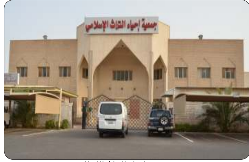
جمعية إحياء التراث الإسلامي

"نحو المعالي"، و "بهداهم اقتده" شعارات أطلقتها جمعية إحياء التراث الإسلامي عبر لجانها ومراكزها الشبابية معلنة انطلاق مشاريعها وأنشطتها الصيفية لصيف هذا العام، وذلك إيماناً منها بأهمية الوقت وخطورة الفراغ، حيث تطرح جمعية إحياء التراث الإسلامي من خلال فروعها ولجانها دورات صيفية للأبناء والبنات من جميع الفئات العمرية لاستثمار واستغلال وقت الفراغ في العطلات الصيفية بما ينمي المهارات والطموح والخبرات الشخصية في أكثر من جانب. ومن هذه الأنشطة وتحت شعار "بهداهم اقتده" تنظم جمعية إحياء التراث الإسلامي بالتعاون مع مركز قيم وهمم التربوي في منطقتي بيان ومشرف ومنطقة جنوب السرة برنامج يشمل العديد من الفعاليات والأنشطة للفئة العمرية من الصف