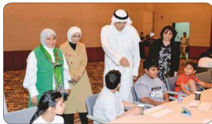
جانب من الورشة التدريبية

وشددت على حرص الهيئة على تدريب المشمولين برعايتها على العديد من الأنشطة والمهارات والأعمال واستثمار أوقات فراغهم وتطوير مهاراتهم بما يعزز من إمكانياتهم وقدراتهم، والاستعداد بفاعلية لمرحلة الدخول في سوق العمل وتحمل المسؤولية والاعتماد على النفس.