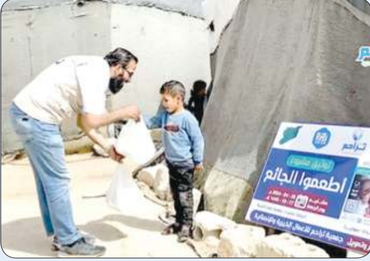
توزيع الوجبات بالمخيمات

تستمر جمعية تراحم للأعمال الخيرية والإنسانية، في تنفيذ برامجها ومشاريعها الخاصة بالنازحين السوريين في مخيمات الداخل، دعماً ومساندة لمن يعيشون واقفاً معيشياً بالغ الصعوبة. وفي هذا السياق قامت الجمعية بتوزيع وجبات الطعام على العائلات السورية النازحة، بهدف تخفيف الجوع عنهم وسد احتياجاتهم الأساسية في ظل ما يواجهونه من أزمات معيشية. ويأتي توزيع الوجبات ضمن مشروع "أطعموا الجائع" وهو أحد مشاريع يوم الجمعة التي تطلقها جمعية "تراحم للأعمال الخيرية والإنسانية"، وهي سلسلة من المشاريع التي تستهدف توفير الاحتياجات الضرورية للفئات المحتاجة داخل وخارج الكويت. هذا وتتيح الجمعية لتبرعائها الكرام المساهمة في مشاريع الموقع الإلكتروني للجمعية tarahum.org أو عبر الخطوط الساخنة للجمعية 98709007 - 98709006.