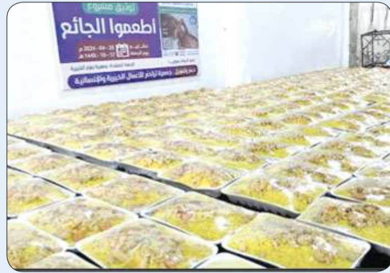
إعداد الوجبات قبيل توزيعها

الأمتين العربية والإسلامية بالخير والسلام. وأضاف البيجان إن الجمعية تحرص على تنظيم مشروع نحر الأضاحي لتطبيق هذه الشعيرة الإسلامية العظيمة في الأعوام الماضية إيماناً منها بدورها الإنساني والتنموي محلياً ودولياً، وتسهيلاً على الإخوة المحسنين في تطبيق سنة رسوله الكريم عليه الصلاة والسلام بما يعود بالنفع العام على قراء المسلمين. وبين البيجان أن المشروع سيتم تنفيذه في الكويت كما سيتم تنفيذه لصالح الأشقاء في غزة