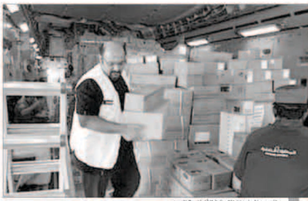
جانب من المساعدات الكويتية للأشقاء في اليمن