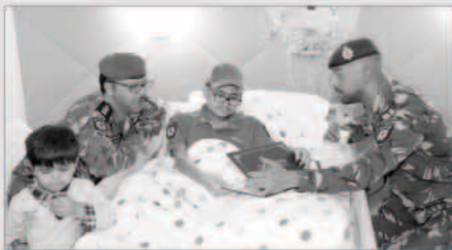
جانب من الزيارة

قام وفد من قطاع الأمن الخاص بزيارة مستشفى بيت عبد الله وكان في استقباله مسؤولي المستشفى حيث