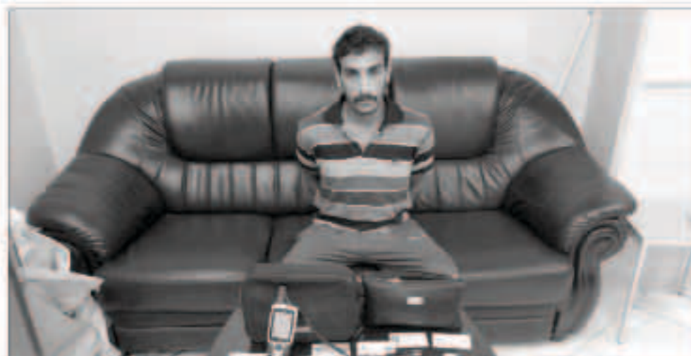
المتهم بعد إلقاء القبض عليه

تكرت الإدارة العامة للعلاقات والإعلام الأمني أن رجال قطاع الأمن الجنائي في الإدارة العامة للمباحث الجنائية (مكتب مباحث الصليبية) تمكنوا من القضاء القبض على أحد الخليجين ارتكب قضايا قيدت ضد مجهول إلا أن لفظة رجال الأمن وعلمهم المتواصل أوقع بالمتهم حيث تم الاشتباه به والقبض عليه ويتكثف أعمال البحث والتحرر تم التأكد من ضلوعه في (7) جنح وجنابات (سرقة لوحة مركبة دبلوماسية - سرقة مركبة وتم العثور عليها - سرقة عن طريق تحطيم حوز وتم ضبط المسروقات - سرقة 3 مركبات - سرقة محتويات مركبة - سرقة مركبة - سرقة مركبة). وبعد اتخاذ الاجراء القانوني تم تفتيش منزل للمتهم والتم العثور على البيانات لا تخصه واعيرة ثايرة خاصة بإحدى القضايا. ومازالت الاعترافات تتوالى للكشف عن قضايا أخرى. ويأتي ذلك ضمن جهود أجهزة وزارة الداخلية في محاربة الجريمة بشتى أنواعها وتلقي لشر المجرمين للإيقاع بهم وتقديمهم للعدالة لنيل جزائهم الرادع.