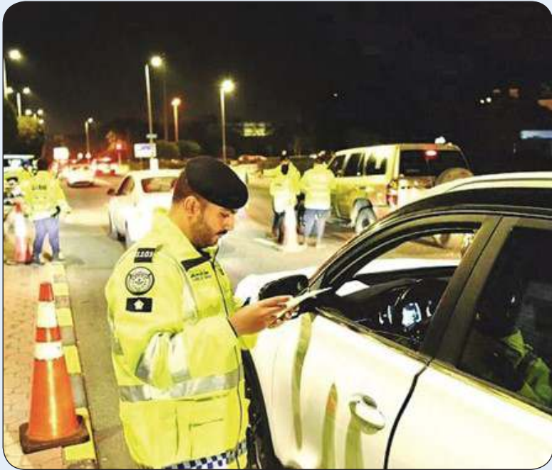
أحد رجال المرور خلال الحملات الأمنية

سجلت الإدارة العامة للمرور أرقاماً قياسية في عدد المخالفات وتوقيف الأحداث، وكذلك في أعداد الحوادث، إذ تم تحرير 54894 مخالفة وضبط 87 حدثاً، ووقوع 1387 حادثاً مرورياً في أسبوع، وتحديدًا في الفترة من 29 مارس حتى 4 أبريل الجاري.