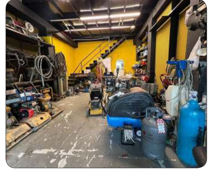
أماكن مخالفة لشروط الأمان