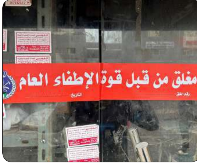
المحلات المغلقة خالفت شروط السلامة من الحرائق