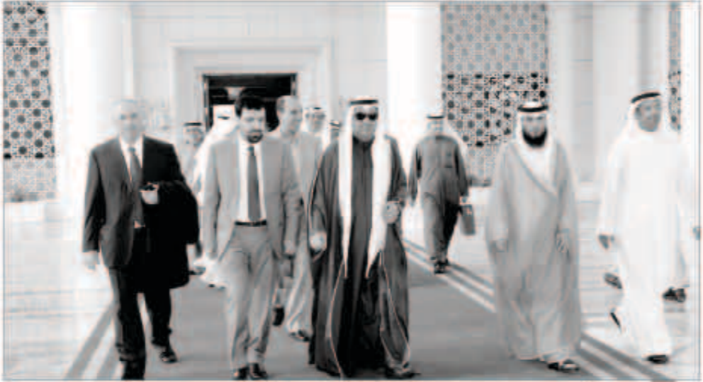
الخرينج أثناء مغادرته البلاد