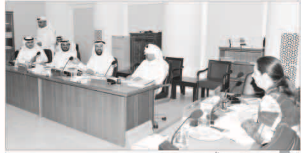
جانب من اجتماع لجنة الأولويات مع الحكومة

وقال الحريجي ان الاجتماع ناقش طول الدورة المستندية لمشروعات