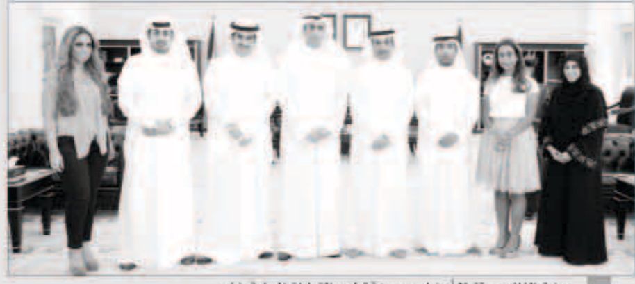
مرزوق الغانم مستقبلاً أعضاء مجموعة تطوير القيادات المحلية «ذخر».

استقبل رئيس مجلس الإمة مرزوق علي الغانم في مكتبه بمجلس الإمة أمس، أعضاء مجموعة تطوير القيادات المحلية «ذخر».