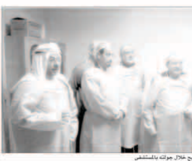
الدعيج خلال جولته بالمستشفى

افتتح سفير دولة الكويت لدى الأردن الدكتور حمد الدعيج أمس وحدة خاصة وقسم عمليات للعيون بمرجع كويتي في مستشفى (المفاد) الخيرية في أحد أحياء العاصمة الأردنية عمان. وأشاد الدعيج في تصريح لوكالة الأنباء الكويتية (كونا) عقب جولته علىقسام المستشفى بجهود الكوادر الطبية والتجهيزات والمعدات في المستشفى الذي يخدم شريحة كبيرة من أبناء أحياء منطقة (نزال) التي تقلتها غالبية من ذوي الدخل المنخفض. وقال إن التبرع الكويتي السخي والمقدم من جمعية الإصلاح الاجتماعي بدولة الكويت هو امتداد لسلسلة الأعمال الخيرية التي جيل عليها المستنون من أهل الكويت منذ القدم. وأعرب في هذا السياق عن اعتزازه وقره بالمشروعات والإعمال الخيرية الداعمة للأوضاع الإنسانية المحتاجين في الأردن.