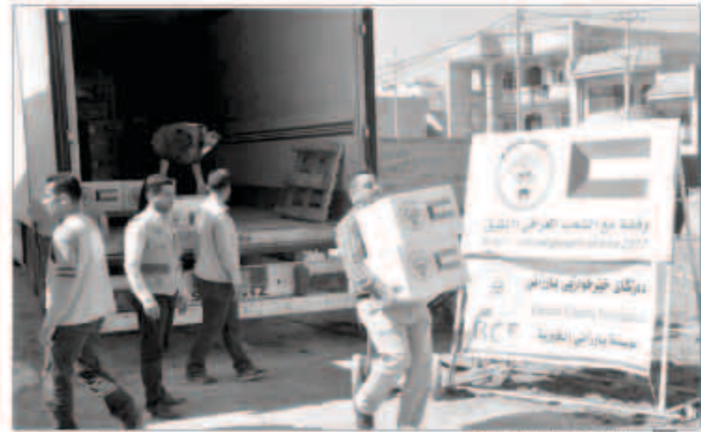
جانب من عملية توزيع المساعدات

وزعت الكويت أمس 750 سلة غذائية على الأسر العراقية النازحة من الموصل والمقيمة خارج المخيمات بمدينة أربيل عاصمة إقليم كردستان العراق بتمويل من الجمعية الكويتية للأغذية وذلك في إطار حملة (الكويت بجانبكم).