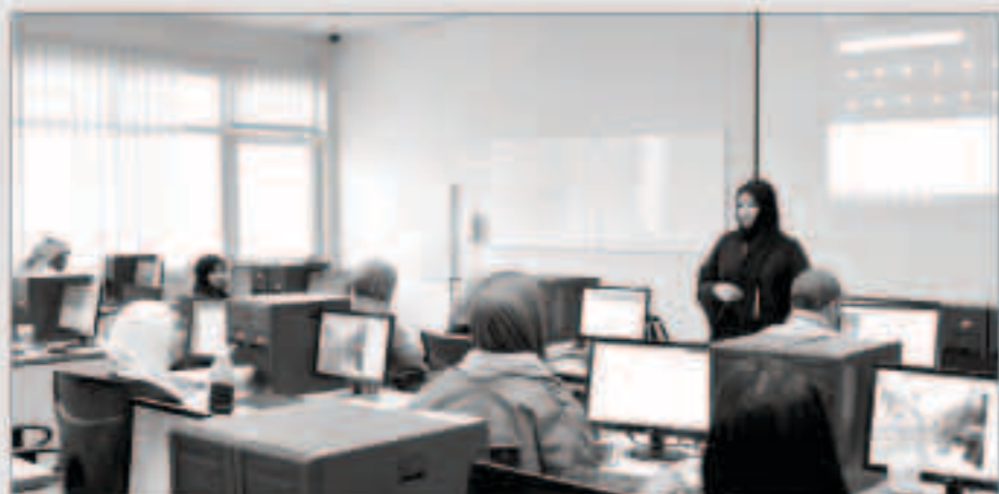
جانب من السيمينار

أقامت كلية علوم وهندسة الحاسوب سيميناراً تعريفياً عن أكاديمية مايكروسوفت في مبنى مدير الجامعة. وقد تضمن السيمينار شرح كيفية تفعيل حساب Office 365 والذي يورد يمكن من تسهيلات الجامعة وتطوير