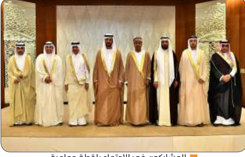
المشاركون في الاجتماع بلقطة جماعية

كما سيتم بحث سبل تعزيز استخدام الوسائل الرقمية والتقنيات الحديثة في نشر الرسائل الأمنية والوصول الفعال إلى مختلف فئات المجتمع وتعزيز التعاون في مجال تأهيل وتدريب الكوادر الإعلامية الأمنية من خلال برامج تخصصية تسهم في رفع كفاءة العاملين في هذا القطاع الحيوي وتطوير مهاراتهم لمواجهة التحديات المستجدة في بيئة الإعلام الرقمي الحديث.