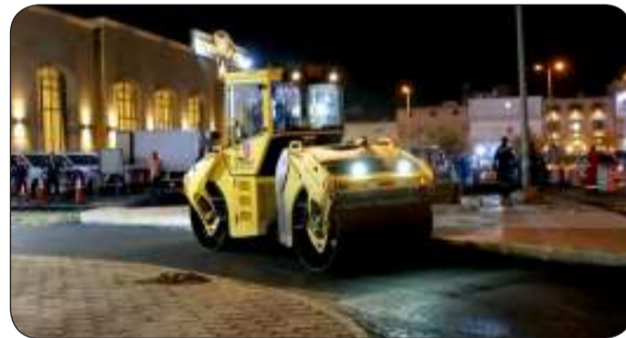
مواصلة أعمال الصيانة الجذرية للطرق بمنطقة المنقف ضمن العقود الجديدة

وأضاف أن القرار الوزاري جاء ليحدد أعداد العاملين في لجان الكنترول بناء على معادلة دقيقة تضمن تلبية