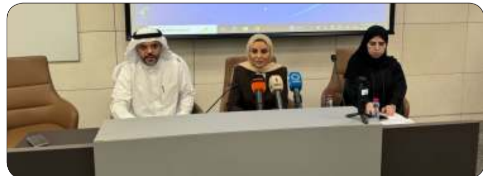
جانب من اللقاء مع رؤساء الجمعيات الخيرية

شدت وزيرة الشؤون الاجتماعية وشؤون الأسرة والطفولة الدكتورة أمال الحويلة على أننا "لن نقبل ولن نسمح بالمس بسمة الكويت بسبب بعض الممارسات الخاطئة سواء بحسن نية أو بشكل متعمد للإساءة للعمل الخيري".