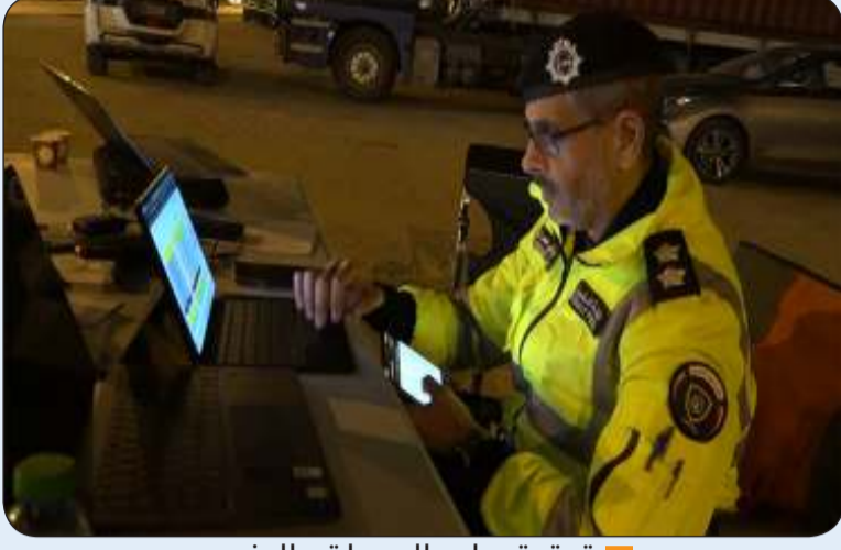
تدقيق على العيوب والرخص

عن ضبط شخص بحوزته مواد مسكرة وشخص مسجل بحقه بلاغ تغيب الرقعي أمس الأول الجمعة أسفرت عن تحرير 1243 مخالفة مرورية وضبط 26 مخالفاً ومطلوباً.