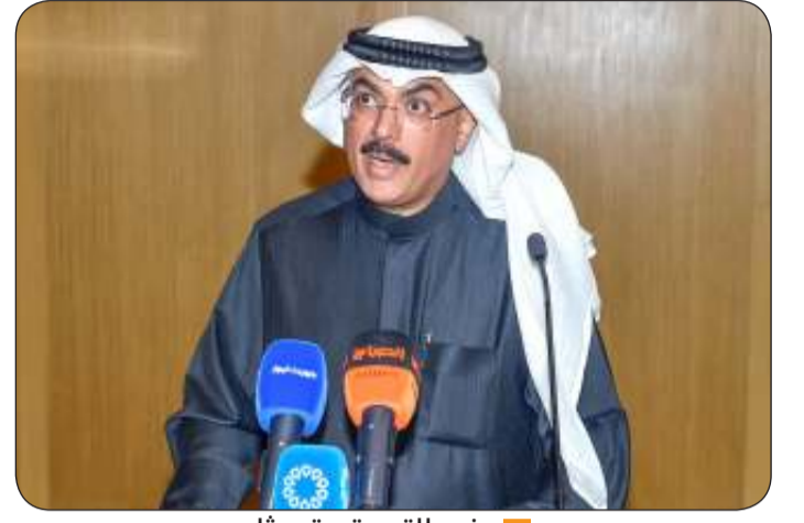
وزير التربية يتحدثاً

وكرم الوزير الطبطبائي ثلاثة فرق كل فريق مكون من خمسة طلاب فازوا بجائزة مسابقة «أبطال الكويت للأمن السيبراني»