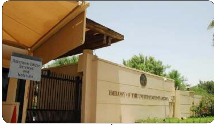
السفارة الأمريكية بالكويت

ودعا فريق Educati-nUSA التابع للسفارة الأمريكية جميع الطلاب وأولياء الأمور لحضور معرض EduX Q8 في أرض المعارض بمشرف القاعة 4A يومي 10 و11 فبراير من الساعة 9:00 صباحاً حتى 12:30 ظهراً، ومن مساءً حتى 8:00 مساءً، بالإضافة إلى معرض الجامعات الأمريكية في قاعة المرجان، فندق كراون بلازا - الفروانية يوم 12 فبراير من الساعة 5:00 مساءً حتى 8:00 مساءً، مشيرة إلى أن هذه الفعاليات ستوفر فرصة قيمة للطلاب للتواصل مع ممثلي الجامعات الأمريكية، واستكشاف خيارات المنح الدراسية، والتعرف على إجراءات القبول.