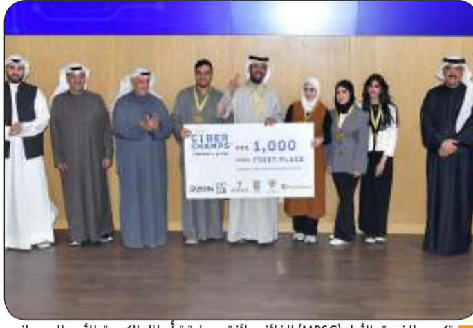
تكريم الفريق الأول (MPSG) الفائز بجائزة مسابقة أبطال الكويت للأمن السيبراني

حيث حصل على المركز الأول فريق "MPSG" أما المركز الثاني فكان من نصيب فريق "zero day hunters" وحل في المركز الثالث فريق "security champs".