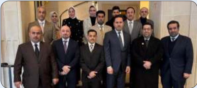
الوفد المشارك من المسؤولين الكويتيين

يقدمها لتطوير القيادات الحكومية. وأضاف أن أعضاء الوفد استمعوا كذلك إلى عروض تعريفية حول التجربة الفرنسية في الإدارة العامة وأساليب إعداد القادة وصناع القرار مما ساهم في تعزيز الاستفادة من أفضل الممارسات الدولية في هذا المجال.