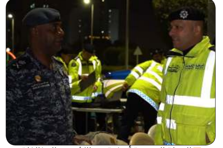
الحملة المرورية أسفرت عن الكثير من المخالفات

مرورية متنوعة وضبط 6 مطلوبين لتنفيذ أوامر ضبط وإحضار و8 مخالفين لقانون الإقامة والعمل وشخص واحد دون إثبات هوية. وأشارت إلى أنه تم أيضا ضبط 6 حالات تغيب وشخص واحد لعدم حمل رخصة قيادة نهائيا وإحالة شخص آخر إلى مباحث الأحداث فيما تم ضبط 17 مركبة ودراجة مطلوبة على نمة قضايا وحجز 19 مركبة ودراجة مخالفة مروريا وإحالة شخص واحد إلى نظارة المرور. وأكدت الوزارة استمرار تنفيذ الحملات الأمنية الطوارئ 112.