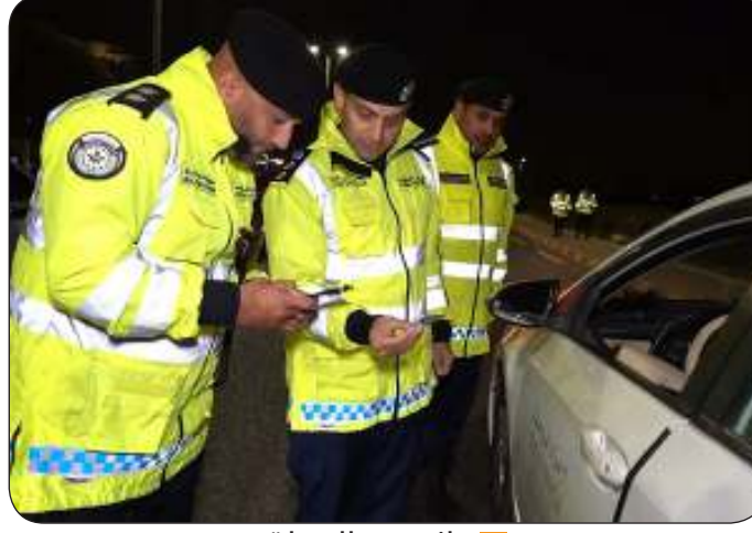
جانب من الحملة