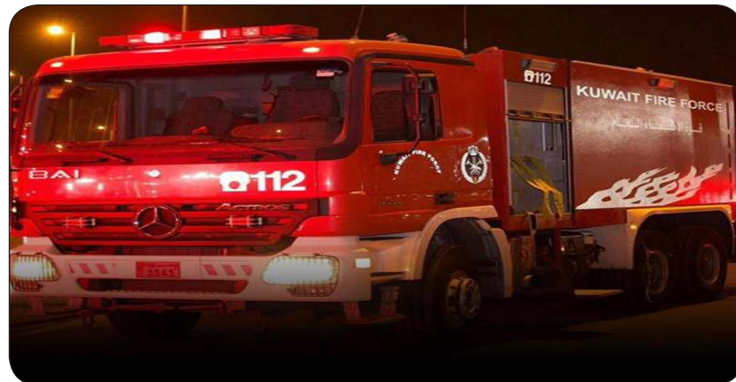
عربات الإطفاء هزعت إلى مكان الحادث

سيطرت فرق إطفاء مراكز السور والتحرير فجر أمس السبت على حريق منزل في منطقة جابر الأحمد حيث باشرت الفرق إخلاء المنزل ومكافحة الحريق والسيطرة عليه وقد أسفر الحادث عن وقوع 4 إصابات تم تسليمهم للطوارئ الطبية.