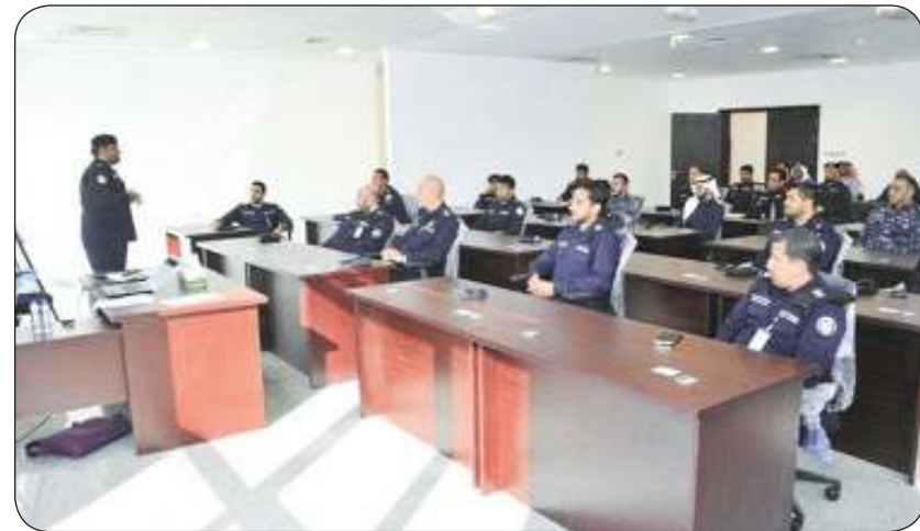
جانب من الدورة

ومع تطبيق «راصد»، قامت وزارة الداخلية بسحب جميع دفاتر المخالفات من الضباط والأفراد بجميع مواقع وزارة الداخلية، وتعميم برنامج «راصد» على أجهزة اللاسلكي الحديثة والهواتف النقالة الذكية لكل الأفراد والضباط التابعين للإدارة العامة للمرور والجهات الأمنية المساندة عبر الأجهزة الذكية.