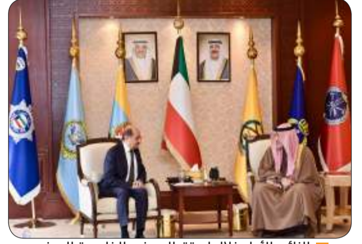
النائب الأول خلال استقباله وزير الخارجية اليمني

ضبطت وافداً بتهمة تزوير تقارير وطبقات مقابل مبالغ مالية «الداخلية»: استمرار صرف المساعدات الاجتماعية للمستحقين من فئة «معاملة الكويتية»