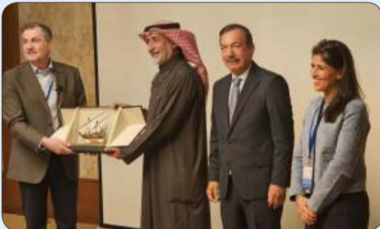
تكريم الدكتور جان بوليكس

أقام قطاع طب الأسنان في وزارة الصحة ورشة عمل متخصصة تحت عنوان «طب الأسنان التجميلي» ضمن جهود الوزارة للتطوير المهني والتعزيز لقطاع طب الأسنان ركزت على أحدث الابتكارات في مجال طب الأسنان الرقمي.