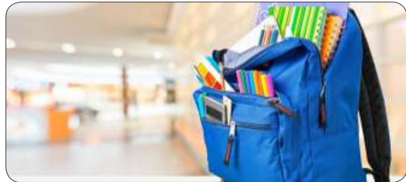
وزارة التربية خففت الحقيبة المدرسية 50 في المئة

بدأت توزيع الكتب المدرسية الجديدة على مختلف المدارس والمناطق التعليمية