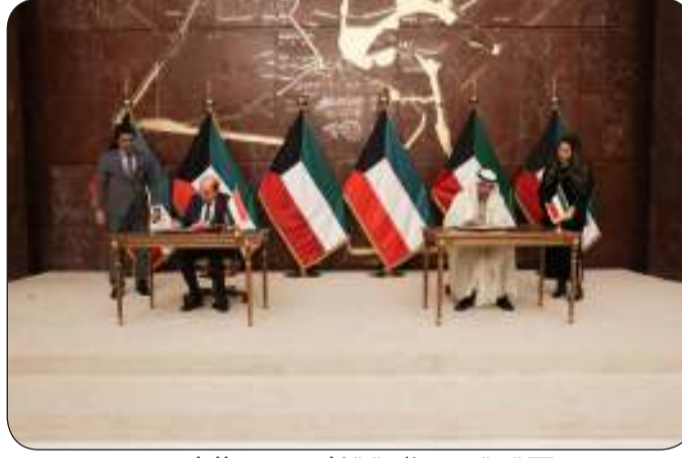
توقيع مذكرة تفاهم بين البلدين