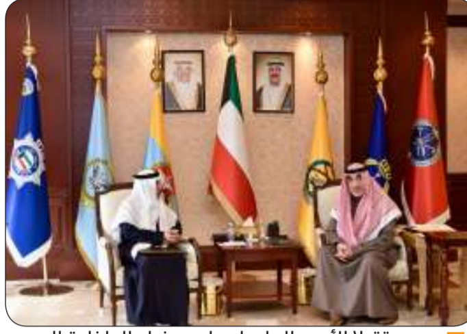
..مستقبلا الأمين العام لمجلس وزراء الداخلية العرب