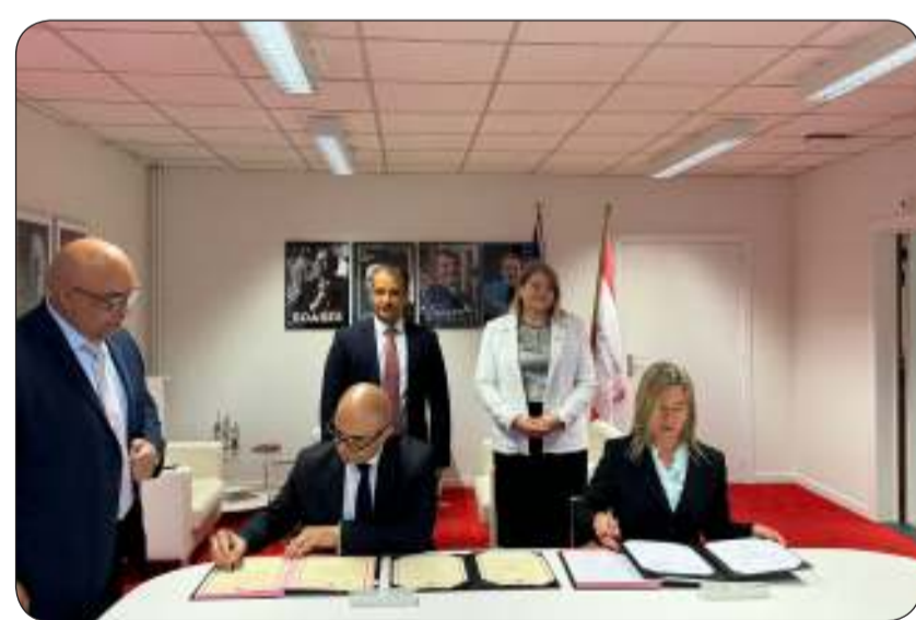
جانب من توقيع مذكرة التفاهم

ونظم المعهد والاتحاد الأوروبي منذ ذلك الحين زيارتين دراسيتين مشتركتين للديبلوماسيين الكويتيين إحداهما إلى مؤسسات الاتحاد الأوروبي في بروكسل وفي وقت سابق من هذا العام والأخرى كانت إلى أبوظبي في عام 2022 لتدريبهم على سياسات الاتحاد الأوروبي. كما نظمت بعثة الاتحاد الأوروبي في الكويت ومعهد سعود الناصر الصباح الدبلوماسي الكويتي في المعهد الدبلوماسي بالكويت بما في ذلك محاضرة للممثل الخاص للاتحاد الأوروبي للخليج لويجي دي مايو في يوليو الماضي وحوار مع نائب الأمين العام لدائرة العمل الخارجي الأوروبية إنريكي مورا في يونيو الماضي.