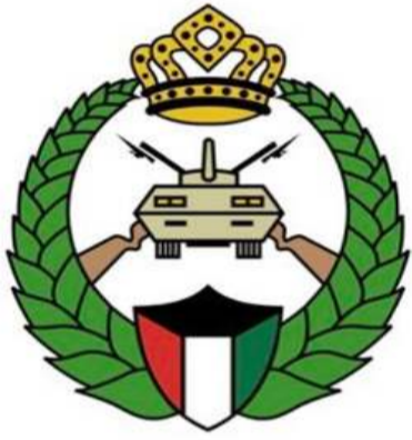
الحرس الوطني Kuwait National Guard