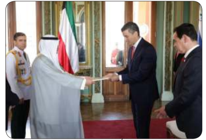
سفيرا لدى الأرجنتين يقدم أوراق اعتمادها سفيرا غير مقيم لدى الباراغواي

حضور وزير الخارجية روبن راميريز ليزكانو. من جانبه حمل الرئيس بينيا حسب البيان السفير البشر نقل حياته الخاصة إلى مقام صاحب السمو أمير البلاد مؤكدا اهتمام جمهورية باراغواي بترسيخ جسور الصداقة ودعمه لكل ما من شأنه رفع مستوى العلاقات