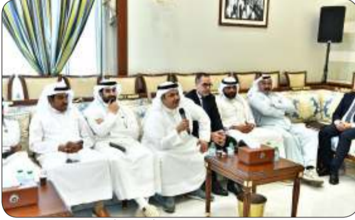
جانب من حضور ممثلي الشركات