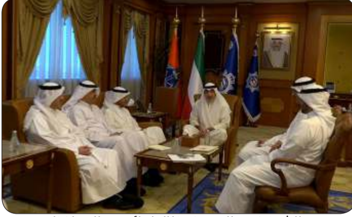
الشيخ فهد اليوسف خلال لقائه مع المحافظين