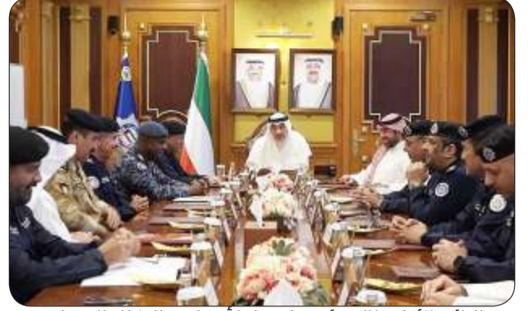
النائب الأول خلال ترؤسه اجتماعاً أمنياً مع الوكلاء المساعدين

تحديث شاملة ومتكاملة انطلاقاً من المنظور الاستراتيجي الشامل نحو تحديث مختلف الأجهزة الأمنية.