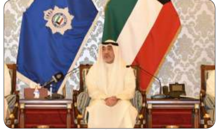
.. وخلال لقائه ممثلي بعض الشركات