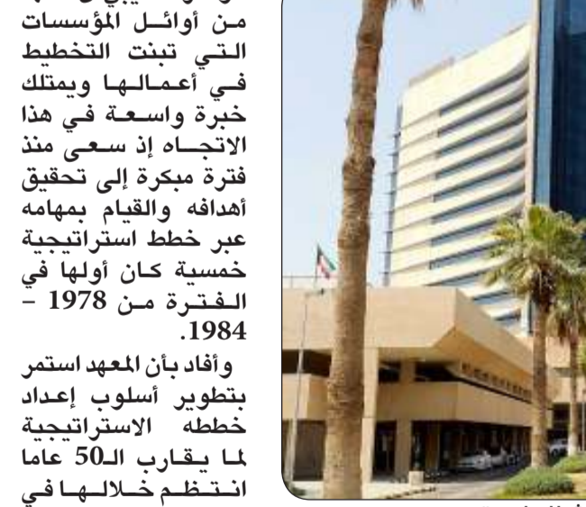
معهد الكويت للأبحاث العلمية