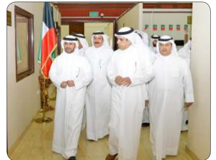
محافظ مبارك الكبير خلال جولته التفقدية بهيئة القوى العاملة

وقد شكر حفاوة الاستقبال وحسن الأداء الوظيفي وتمنى لهم التوفيق. الاحتياجات والمعوقات الإدارية الخاصة للمراجعين وإيجاد الحلول المناسبة لذلك.