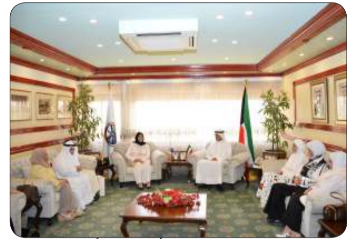
محافظ الأحمدى مستقبلاً رئيس وأعضاء فريق أصدقاء المعاقين

مستقبلاً ودعم الفريق من خلال السعي إلى توفير متطلباته واحتياجاته بالتنسيق والتعاون مع الجهات المعنية، متمنياً لهم دوام التوفيق والنجاح. اللقاء على أنشطة وفعاليات الفريق، مشيداً بجهودهم ودورهم في دمج أبنائنا ذوي الاحتياجات الخاصة في المجتمع، مؤكداً حرصه على التعاون المشترك