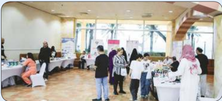
جانب من المشاركين في اليوم التوعوي