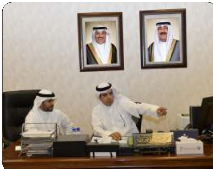
المحافظ أثناء الزيارة

قام محافظ مبارك الكبير صباح البدر بزيارة تفقدية إلى هيئة القوى العاملة بالمحافظة وكان في استقباله نائب مدير عام لشؤون العمالة مساعد المطيري والسادة