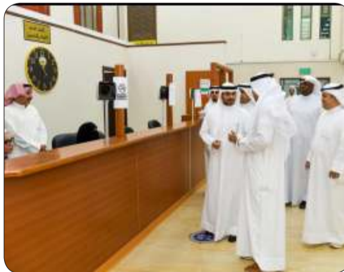
جانب من الجولة