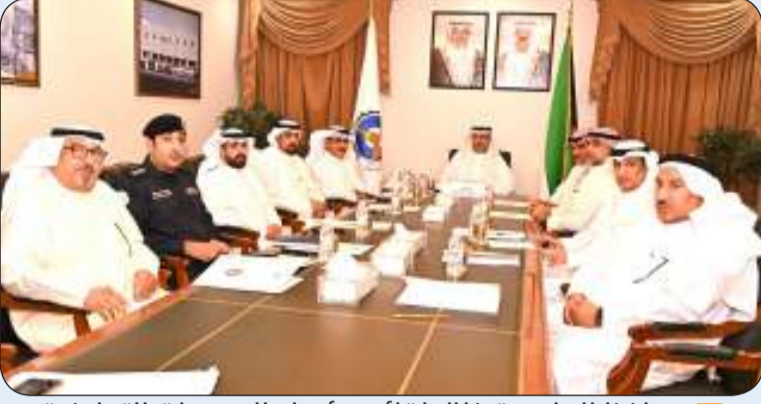
محافظ العاصمة خلال لقائه برؤساء الجمعيات التعاونية

أكد محافظ العاصمة الشيخ عبدالله العلي أن العمل التعاوني في دولة الكويت يعد الركيزة الأساسية في تنمية المجتمع من خلال ما يقدمه من خدمات متنوعة لرفع المستوى الاقتصادي والاجتماعي للأفراد والمؤسسات. جاء ذلك خلال استقبال المحافظ في مكتبه صباح أمس لرؤساء الجمعيات التعاونية لكل من مدينة جابر الأحمد والدوحة ومنطقة شمال غرب الصليبخات.