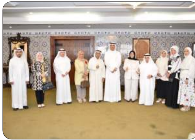
صورة جماعية من اللقاء