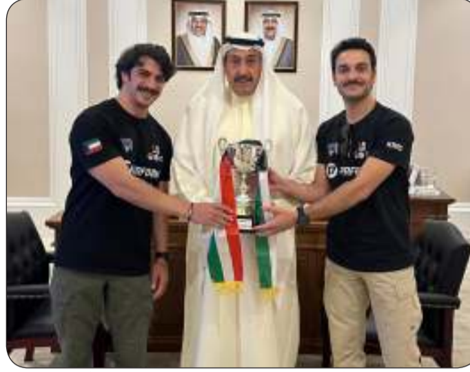
جانب من تكريم فريق الإنقاذ والاستجابة الكويتي