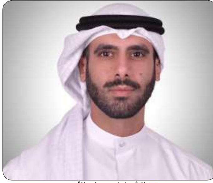
الشيخ فهد جابر الأحمد

ترشيح وزارة الإعلام بدولة الكويت وموافقة وزارات الإعلام بدول مجلس التعاون. يذكر أن مؤسسة الإنتاج البرامجي المشترك لدول مجلس التعاون