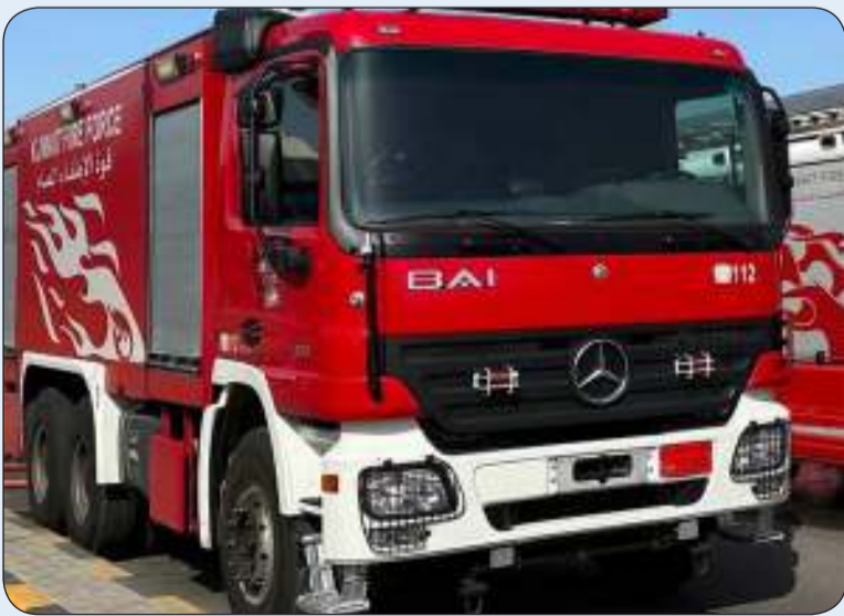
فرق الإطفاء سيطرت على حريق بالمهولة

سيطرت فرق الإطفاء ظهر أمس الأربعاء على حريق شقة في عمارة بمنطقة المهولة، حيث أصابت تذكر.