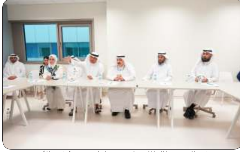
وزير الصحة جلال الاجتماع مع قيادات مستشفى الأميري

أهمية استمرار التعاون والتنسيق بين كل أقسام الأمراض الباطنية لتحقيق الأهداف المرجوة والارتقاء بالخدمات الصحية المقدمة للمواطنين والمقيمين معرباً عن تقديره للجهود التي تبذلها تلك الأقسام في مختلف التخصصات حيث تمت مناقشة العديد من المواضيع والتحديات التي تواجه أقسام الأمراض الباطنية وقد أكد الوزير العوضي أهمية تحقيق التوازن في توزيع الكوادر الطبية لضمان تقديم