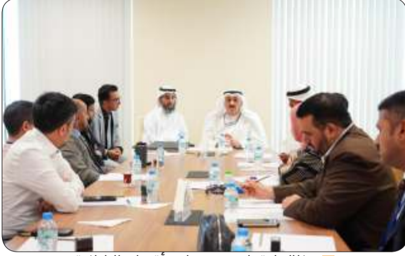
وخلال اجتماعه مع مجلس أقسام الباطنية

حول نظام الخفارات وكيفية تحسينه لضمان تقديم رعاية مستمرة وشاملة للمرضى على مدار الساعة وأيضاً دوام العيادات الخارجية وكيفية تنظيمه بما يتناسب مع احتياجات المرضى وضمان توفّر الرعاية الطبية في الأوقات المناسبة وعادلة توزيع الأطباء على المستشفيات. كما تناول الاجتماع توزيع الأطباء حديثي التخرج على الأقسام المختلفة وأهمية تدريبهم وتأهيلهم بشكل جيد ليكونوا قادرين على تحمل المسؤولية وتقديم أفضل الخدمات الصحية.