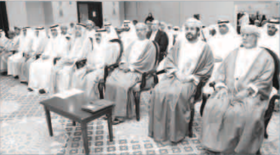
جانب من المحور

فتح محادثات الشراكة على مختلف الأصعدة إضافة إلى حشد المؤسسات العمانية والكويتية بين القطاعين العام والخاص للاستفادة من الفرص والخبرات. وأشار إلى «أننا نمر مرحلة هي الأصعب منذ مدة عام حيث يجب أن نتحدث مع بعضنا البعض ونسلط الضوء على التحديات القادمة إلى الخليج لأنه لا يمكن أن تعزل الخليج وتجعله إلى بلد آخر» مشيراً إلى أن منطقة الخليج أصبحت سن «أكثر مناطق العالم نشاطاً». وذكر أن الملتقى يأتي في ظل التغيرات التي يشهدها العالم من حولنا وبرز أهمية التعاون والتكامل بين الأشقاء. وأضاف أن الملتقى الكويتي العماني يسلط الضوء على القضايا الثنائية بين البلدين من وجهة نظر خبراء وشخصيات اعلامية وسياسية واقتصادية وثقافية بارزة في البلدين.