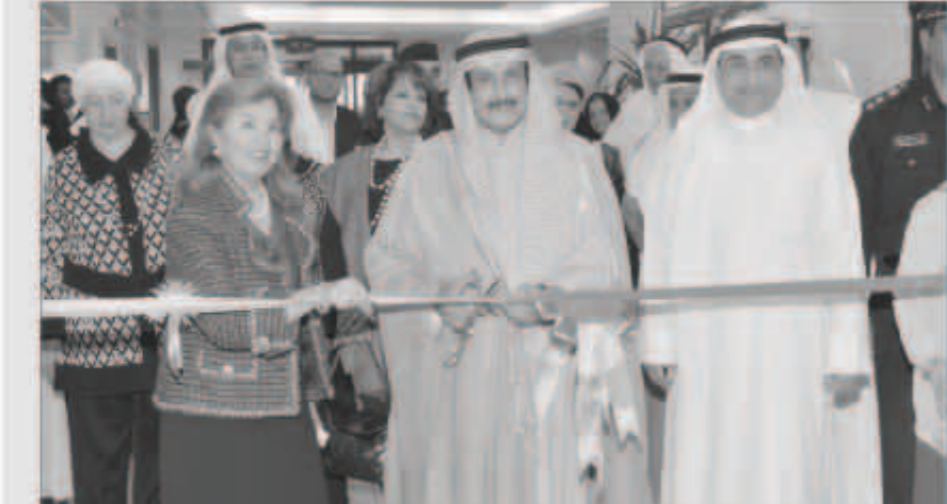
الشيخ ابراهيم الدعيح مفتتحاً المعرض

دعا محافظ الاحمدى الشيخ الدكتور ابراهيم الدعيح إلى زيادة تضامن الجهود الحكومية والأهلية لخدمة ذوي الاحتياجات الخاصة في البلاد ودعمهم في مجالات الحياة الإنسانية المختلفة في المجتمع. وقال الشيخ الدعيح في تصريح صحافي على هامش افتتاحه المعرض التأهيلي الرابع للجمعية الكويتية لرعاية المعاقين في مركز الرعاية النهارية في المحافظة أمس «أشد على ايدي القائمين على الجمعية الكويتية لرعاية المعوقين وأعضاء مجلس ادارتها والناشطين في هذا المجال الإنساني ودعمهم بما يقومون به من خدمة إنسانية كبيرة تستهدف شريحة من أبنائنا ذوي الاحتياجات الخاصة».