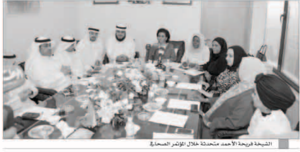
الشيخة فريحة الأحمد مترسلة خلال المؤتمر الصحافي

قالت رئيسة الجمعية الكويتية للأسرة المالية ورئيسة نادي الفتاة الرياضي الشبيخة فريحة الأحمد ان الأسرة العربية تواجه تحديات خطيرة في الوقت الراهن تستدعي معالجة قضايا المجتمع ككل بشكل دوري ومستمر.