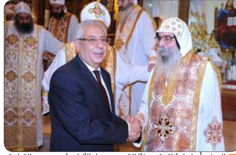
السفير أسامة شلتوت مهتماً القمص بيجول الأنبا بيشوي بعيد القيامة

ان انتهت الفرصة لتوجيه الشكر لسمو أمير البلاد الشيخ مشعل الأحمد وسمو ولي عهد الأمين الشيخ صباح الخالد، وللحكومة المؤقرة وشعب الكويت الكريم على رعايته الكريمة لأبناء الجالية المصرية في الكويت، ونجدد العزيمة على العمل سوياً لإعلاء قيم التسامح والمحبة وإرساء دعائم السلام والاستقرار في ربوع المنطقة.