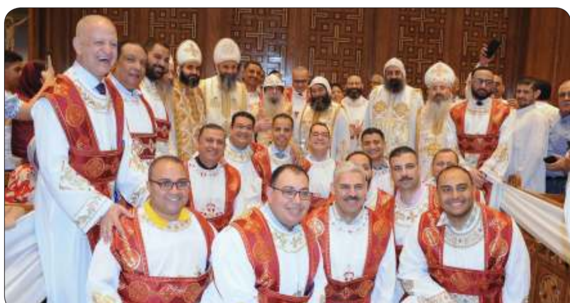
القائمون على الكنيسة في لحظة جماعية