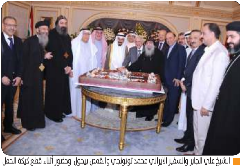
الشيخ علي الجابر والسفير الإيراني محمد توتونجي والقمص بيجول وحضور أثناء قطع كيكة الحفل

وتابع: إن هذا العيد ليس فقط مناسبة دينية عظيمة، بل هو أيضاً فرصة للتأكيد على الوحدة والتآزر بين أبناء الشعب المصري، إلا فبرغم اختلاف الأديان، أن الروابط الأخوية التي