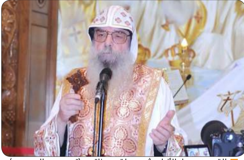
القمص بيجول الأنبا بيشوي يلقي عظة

وأضاف: قصة الإنسان على الأرض قصيرة لكن في الأبدية ليس هناك انتهاء، لذلك على الإنسان أن يعيش حياته على الأرض وهو يعد نفسه لحياة لا تنتهي وأن يدرك أن هناك جزءاً في الآخرة فمن تعب وعاش بالأمانة والإيمان يكافئه الله ومن قضى حياته في لهو وعبث لا ينال السعادة الأبدية.. وختم راعي كاتدرائية مارمرقس للأقباط الأرثوذكس بدولة الكويت كلمته فقال: باسم قداسة البابا الأنبا تواضروس الثاني بابا بطريرك الكرازة المرقسية في مصر وكل بلاد المهجر، ونيافة الأنبا أنطونيوس مطران القدس والكويت والشرق الأدنى، وأخوتي كهنة الكاتدرائية المرقسية في دولة الكويت أهنيكم يا أخوتي بعيد القيامة المجيد، وأحمل لكم أمانيهم وصلواتهم بأن يعم السلام والتنمية والرخاء في كل ربوع البشرية.