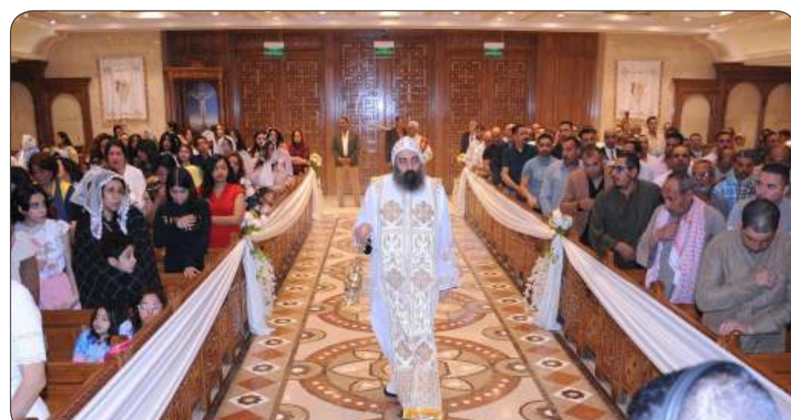
من مراسم الاحتفال