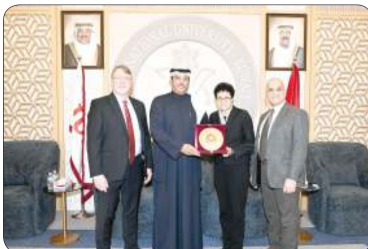
تبادل الدروع التذكارية