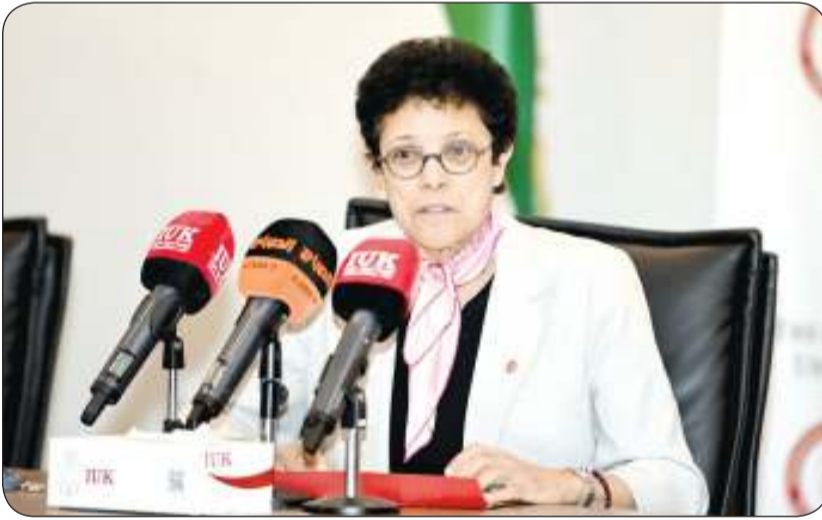
الدكتورة كارول تروتمان تلقي كلمتها

وقال الدكتور الهديبان إن هذه الاتفاقيات التي نجتهد ونعمل على توقيعها هي لصالح بلادنا، مستدركا أن الجامعة الدولية تتطلع إلى توسيع الاختصاصات