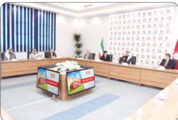
ولقطة من اللقاء بين إدارة الجامعة ووفد جامعة أوهايو الأمريكية