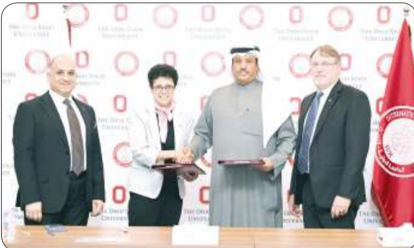
ويتبادلان نسخاً من الاتفاقية

والجامعة الدولية منذ تأسيسها، حرصت الجامعة الدولية على إقامة شراكات استراتيجية مع عدد من الجامعات العالمية المتميزة، بهدف تطوير برامجها الأكاديمية، وتوسيع آفاق الطلاب، وتحقيق التميز العلمي. هذه الشراكات لم تقتصر على المجالات الطبية فقط، بل شملت أيضا العديد من التخصصات الأخرى مثل الهندسة، والإدارة، والآداب والفنون، والعلوم. وتضع الجامعة الدولية نصب عينها المستقبل الأكاديمي للكويت، وتسعى إلى أن تكون شريكاً رئيسياً في تعزيز جودة التعليم في البلاد، من خلال هذه الشراكات، وتوفير بيئة تعليمية متطورة تساهم في إعداد جيل من الشباب المؤهلين للعمل في مختلف المجالات العلمية والمهنية.