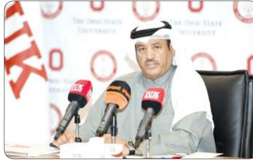
الدكتور الهديبان يلقي كلمته