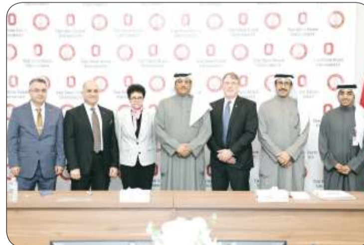
لقطة جماعية عقب التوقيع