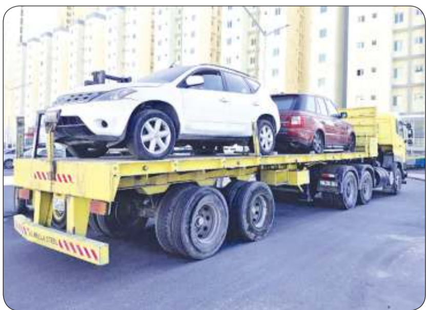
رفع السيارات المهمة

وأكد أن الجولة أسفرت عن رفع 28 سيارة مهمة وسكراب وقارب وتحرير 36 مخالفة ونظافة عامة وإشغالات طرق، بالإضافة إلى توجيه 68 مصفقا لإزالة تضررت سيارات مهمة وحوايات تجارية وتم تبديل 28 حاوية قديمة بجديدة. وأشار إلى تواصل الجولات الميدانية من قبل الفريق الرقابي بإدارة النظافة العامة وإشغالات الطرق، مبينا في هذا الخصوص عدم تعاون الفريق الرقابي في اتخاذ جميع الإجراءات القانونية حيال المخالفين للوائح النظافة العامة وإشغالات الطرق.