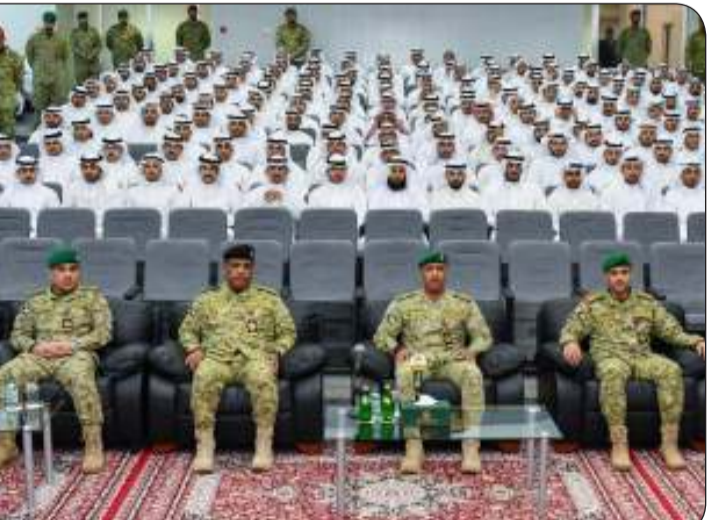
قرعة اختيار المتقدمين امتازت بالشفافية والعدالة

الشفافية والمصادقية في جميع المراحل معرباً عن تمنياته لمن حالفهم الحظ في القرعة بالتوفيق والنجاح.