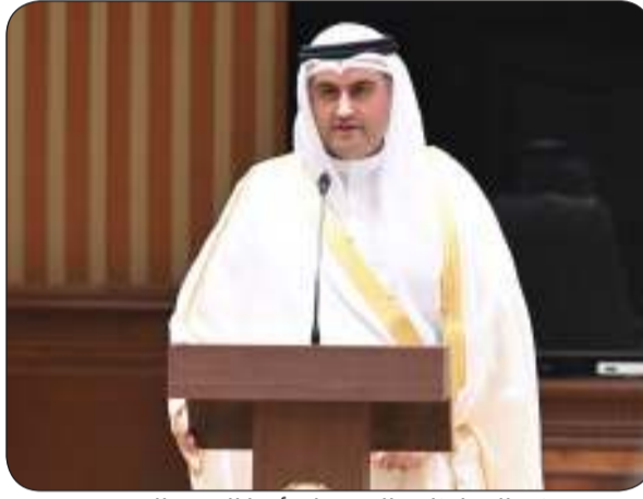
وزير العدل ناصر السميح مؤدياً اليمين الدستورية

بعث سمو أمير البلاد الشيخ مشعل الأحمد ببرقية تهنئة إلى الرئيس جواو مانويل لورينسو رئيس جمهورية أنغولا الصديقة عبر فيها سموه عن خالص تهنئته بمناسبة العيد الوطني لبلاده. متمنياً سموه له موفور الصحة