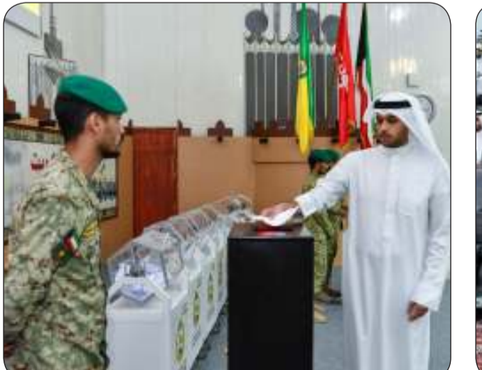
القرعة العلنية لاختيار دفعة جديدة من ضباط الميدان