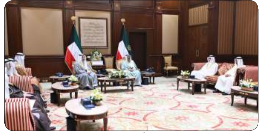
صاحب السمو خلال استقباله الشيخ فهد اليوسف ومعه وزير العدل الجديد