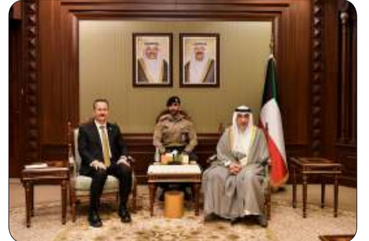
رئيس الوزراء بالإنبابة بحث ورئيس الصناعات الدفاعية التركية تعزيزاً للتعاون بين البلدين

الصباح ونائب رئيس الأركان العامة للجيش الكويتي اللواء الركن طيار صباح الجابر وسفيرة الجمهورية التركية لدى البلاد طوبى نور سونمز.