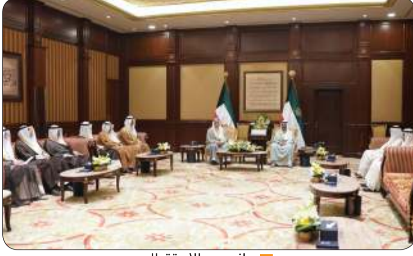
جانب من الاستقبال

الأسرة ومكتب فحص البلاغات والشكاوى وسير العمل بهم ومراجعة بيانات كشوفها الشهرية والتصرف بالإحالة والحفظ في القضايا وعضوية مجلس تأديب أعضاء السلكن الدبلوماسي والقنصلي بوزارة الخارجية. كما شغل ممثل النيابة العامة خبيراً من ذوي التخصص في مجال جرائم الاتجار بالبشر بسجل جمعية النواب العموم العرب ومحاضراً في معهد الكويت للدراسات القضائية والقانونية. وعمل أيضاً على تدريب الباحثين القانونيين المرشحين للعمل كوكلاء للنائب العام في معهد الكويت للدراسات القضائية والقانونية إضافة إلى عدد من الخبراء والمشاركات المحلية الدولية.