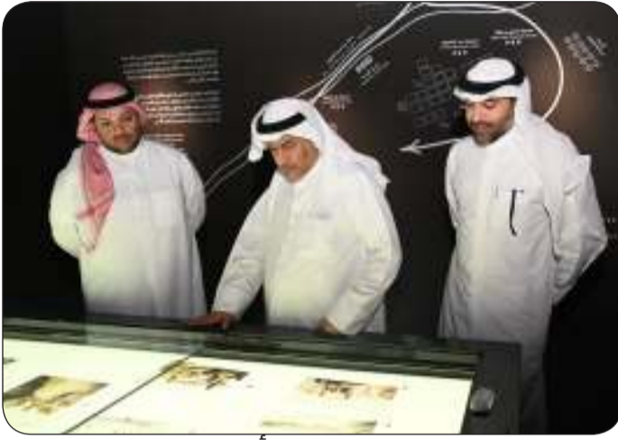
المحافظ يطلع على أعمال الترميم