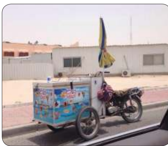
إيقاف عربات الآيس كريم

ذكرت الهيئة العامة للغذاء والتغذية أنه سيتم إيقاف جميع تراخيص عربات الآيس كريم ويكون آخر يوم لها في الموقع 31 ديسمبر المقبل. وأوضح كتاب الهيئة المرسل إلى البلدية بشأن آلية تطبيق وقف تراخيص عربات الآيس كريم أن الإيقاف جاء بعد اجتماعات عدة مع الجهات المعنية. وأشارت الهيئة