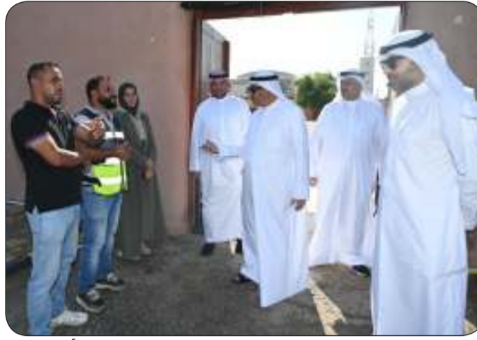
محافظ الجهراء تفقد عملية ترميم القصر الأحمر