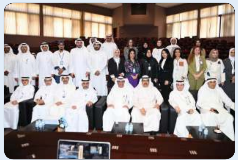
■ المحافظ خلال الزيارة

لتحقيق النجاح الأكاديمي. هذا وقد تم تقديم عرض مرئي له يشرح آلية الهيئة في تطوير المناهج الدراسية لتعكس متطلبات سوق العمل، والتي تهدف إلى تحسين الخدمات التعليمية المقدمة للطلاب، والتأكيد على تعزيز القيم الأخلاقية لديهم. ختاماً أثنى محافظ حولي على الجهود الواضحة والمبذولة من قبل مدير وأعضاء الهيئة العامة للتعليم التطبيقي والتدريب متمنياً لهم دوام التقدم والنجاح في خدمة وطننا العزيز.