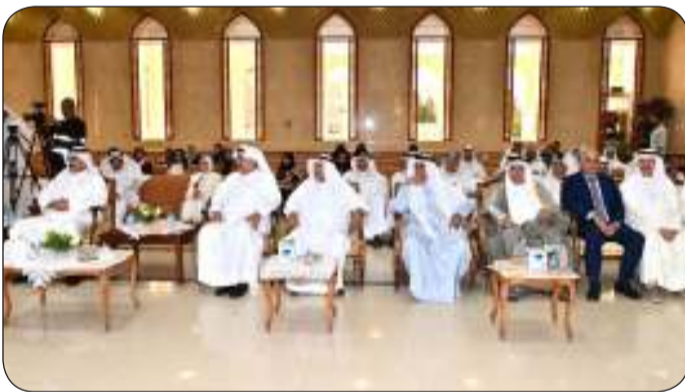
■ جانب من الحضور يتقدمهم محافظ العاصمة