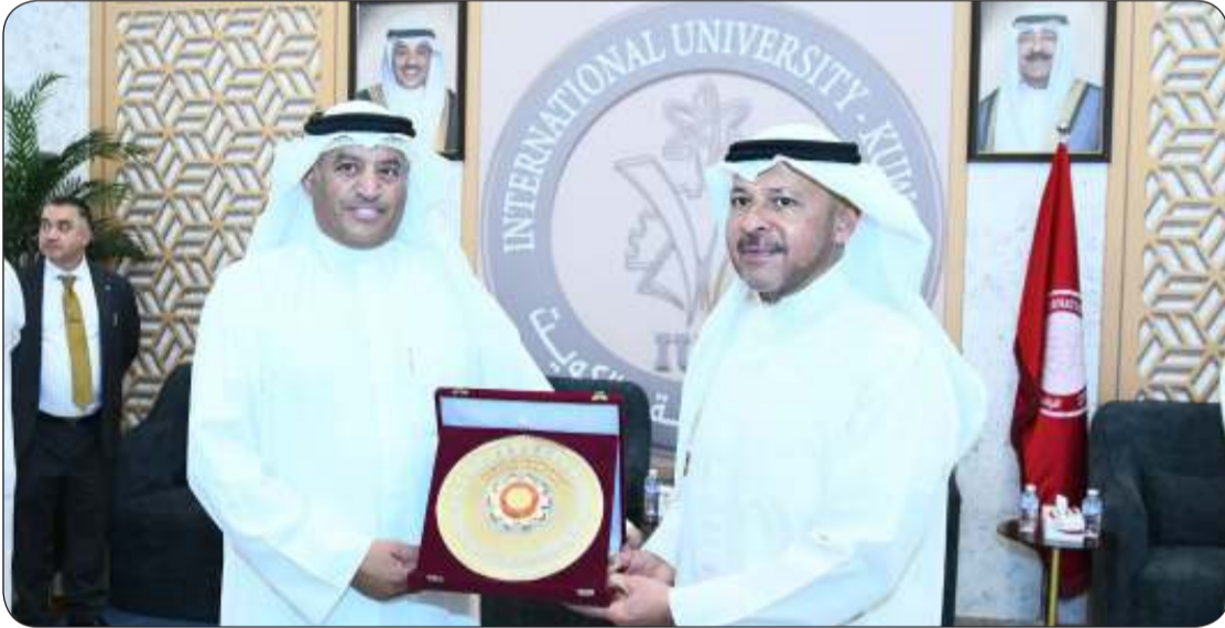
■ د.بركات الهديبان يهدي المحافظ درعاً تذكارية

قام محافظ الفروانية الشيخ عذبي العذبي الصباح، بزيارة إلى الجامعة الدولية للعلوم والتكنولوجيا، صباح أمس، حيث كان في استقباله رئيس مجلس أمناء الجامعة الأستاذ الدكتور بركات عوض الهديبان، ونائب الرئيس للشؤون الإدارية