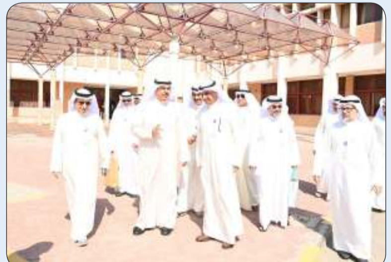
■ محافظ حولي متفقاً المعهد العالي للخدمات الإدارية

قام محافظ حولي علي الأصفر بجولة تفقدية في المعهد العالي للخدمات الإدارية بمنطقة حولي، برفقة مدير عام الهيئة العامة للتعليم التطبيقي والتدريب الدكتور حسن الفجاء المهندس ومدير عام المعهد طلال الصفيري وعدد من أعضاء الهيئة التدريسية وقياداتها. وتم خلال الجولة متابعة سير العمل الأكاديمي ومدى جاهزية المعهد للعام الدراسي، كما تم بحث أهمية دور المدرسين في بناء شخصية الطلاب وتشجيعهم على الالتزام بالمحاضرات