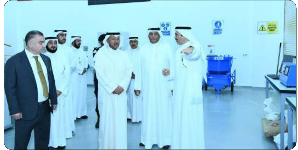
■ المحافظ يستمع إلى شرح حول البيئة التعليمية للجامعة

محافظة العاصمة نظمت ندوة تعريفية حول برنامجي «سهل» و «حافر»