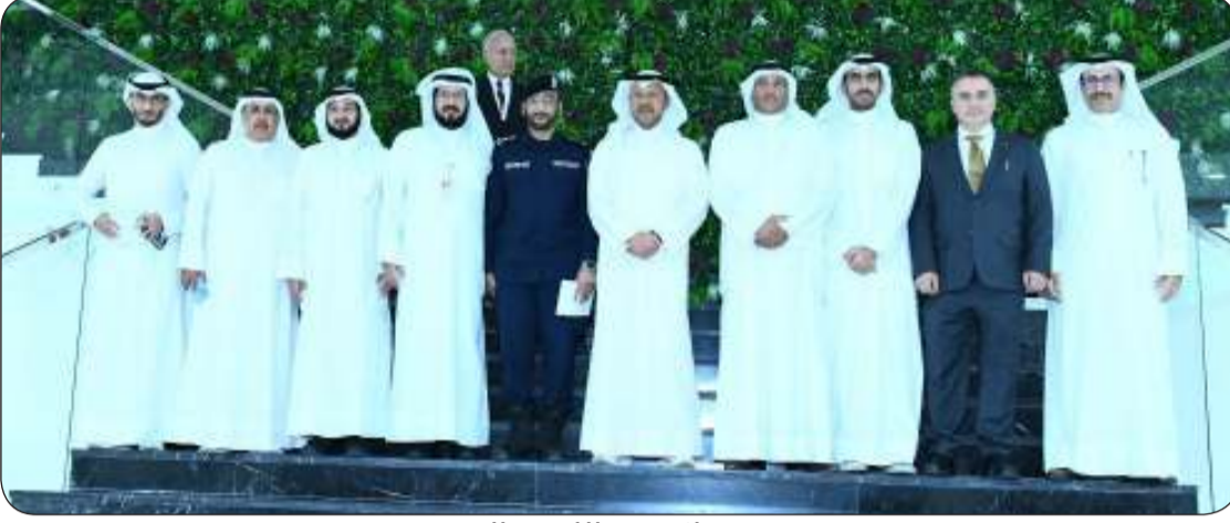
■ جانب من الاستقبال

الهديبان: نضع توجيهات صاحب السمو الأمير وولي عهده الأمين نصب أعيننا دائماً بهدف الارتقاء بالتعليم وتقديم أفضل مخرجات لبلدنا الكويت