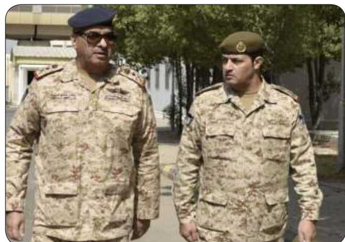
■ جانب من الزيارة