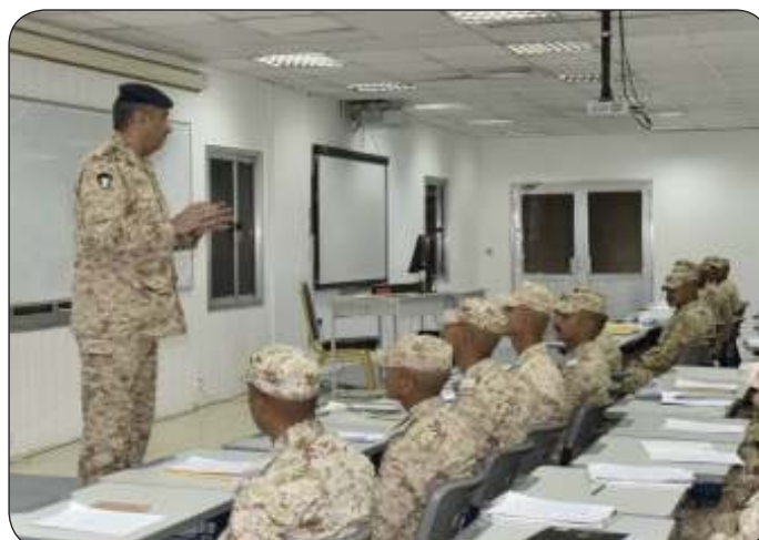
■ رئيس الأركان خلال زيارته لكلية علي الصباح العسكرية