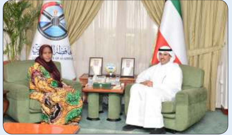
■ محافظ الأحمدني مستقبلا السفيرة الكينية

استقبل محافظ الأحمدني الشيخ حمود الجابر في مكتبه بديوان عام المحافظة، سفيرة جمهورية كينيا لدي الكويت السفيرة حليلة محمود، حيث جرى التعارف وتبادل الأحاديث الودية التي تناولت العلاقات الثنائية التي تربط البلدين الصديقين وسبل تعزيزها في جميع المجالات، كما تركز اللقاء على استعراض وبحث الفرص والإمكانات القائمة لتطوير التعاون المشترك وتبادل الخبرات بين البلدين على مستوى الأنظمة الإدارية المحلية عموماً وعلى صعيد المحافظات