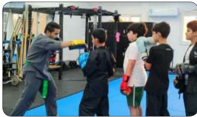
■ الاهتمام بالجانب الرياضي في مرحلة النشء