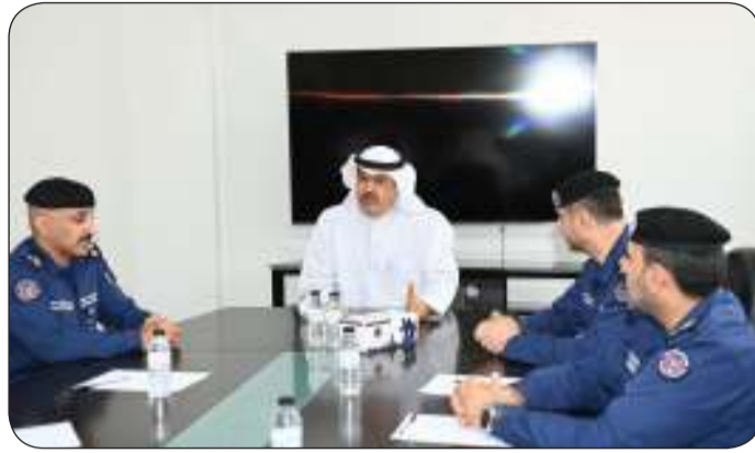
■ محافظ حولي خلال الجولة

للإطفاء لموسم الأمطار ومدى جاهزيتهم لمواجهة التحديات المحتملة خلال موسم الأمطار.