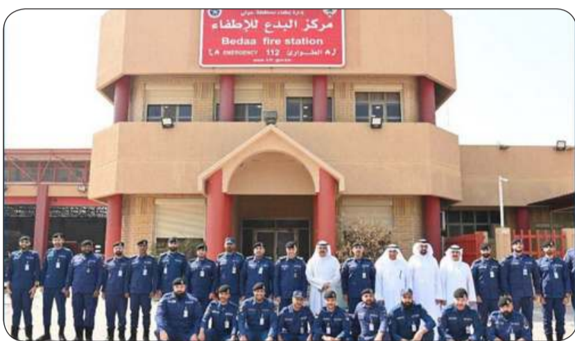
■ صورة جماعية

وأنسى المحافظ بالجهود المبذولة في حماية أرواح المواطنين والمقيمين سائلاً المولى عز وجل أن يحفظ الكويت وشعبها تحت راية صاحب السمو أمير البلاد الشيخ مشعل الأحمد وولي عهده الأمين الشيخ صباح الخالد.