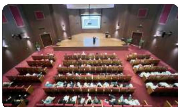
■ ورش عمل لتطوير الكوادر البشرية

وأكدت الأنصاري أن ما تقدمه الهيئة من مشاريع وبرامج تنموية يأتي ضمن الخطة الإنمائية للدولة إن