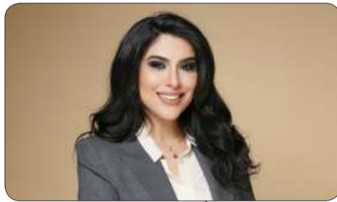
■ أسرار الأنصاري

للشباب الكويتي أكثر من 75 دورة تنموية مجانية في 6 مجالات حيوية ومهمة.