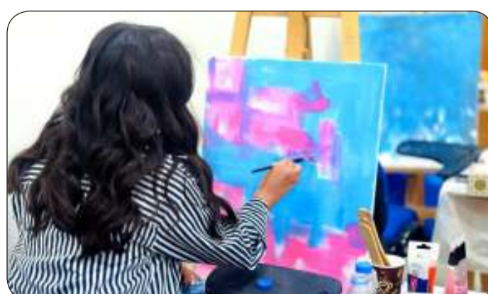
■ الاهتمام بالفنون