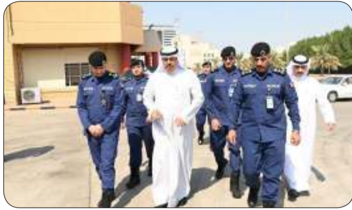
■ جانب من الجولة