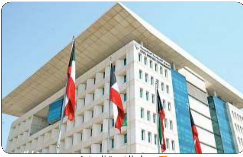
ديوان الخدمة المدنية

وذكر البيان أن الدفعات المقبلة ستشمل تخصصات الهندسة الصناعية والكيميائية والبيترول بالإضافة إلى الدبلومات الفنية بأنواعها ودبلوم القانون وذلك لتلبية احتياجات الجهات الحكومية من التخصصات التي تتناسب مع الوظائف في كل جهة. وأفاد بأن ترشيح المسجلين يأتي على دفعات متتالية حتى يتم استيعاب كافة المسميات الوظيفية الجديدة التي تم استحداثها للتخصصات الراكدة وتعريف جهات العمل بها وكيفية الاستفادة منها داعيا المرشحين في دفعة اليوم إلى مراجعة جهة العمل التي رشحوا لها مباشرة دون الحاجة لمراجعة الديوان.