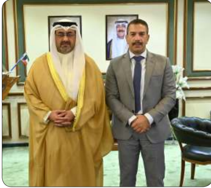
.. ومستقبلا السفير القبرصي