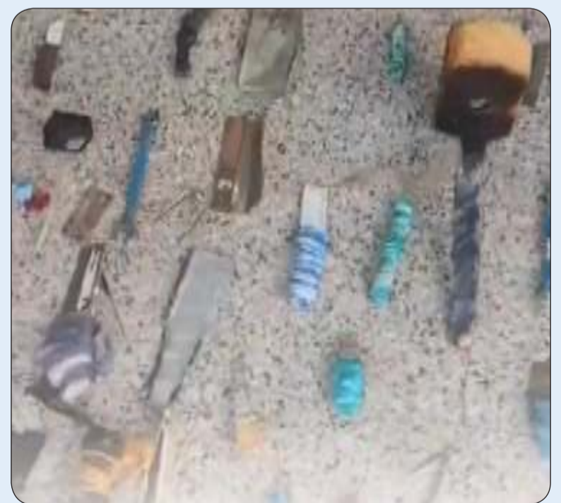
جانب من المضبوطات

مخدرة "بحوزة عدد من النزلاء، وتمت إحالة المضبوطات إلى جهات الاختصاص وجار اتخاذ الإجراءات القانونية اللازمة.