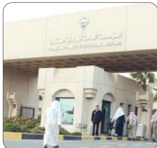
المؤسسة العامة للرعاية السكنية

الخصيص وذلك لاستلام بطاقة القرعة خلال أوقات الدوام الرسمي. وأوضحت أن من يتخلف عن استلام بطاقة القرعة الخاصة به خلال الأيام المحددة بهذا الإعلان سيتم استبعاد اسمه وإدخال الأسماء التي تليه في التخصيص. كما دعت المواطنين المخصص لهم القسائم الحكومية في هذا المشروع ولم ترد أسماؤهم ضمن هذا الكشف الحضور إلى مبنى المؤسسة في جنوب السرة الساعة التاسعة صباح يوم الثلاثاء المقبل مصطحبين معهم قرار التخصيص والبطاقة المدنية للدخول ضمن الاحتياط. وأشارت المؤسسة إلى أن الراغبين بالتسجيل على دفعة قادمة ممن وردت أولوياتهم في كشوف القرعة بمراجعة مبنى المؤسسة في مدى أقصاء الثلاثاء المقبل حتى الساعة 12 ظهراً على أن لا يقبل أي تأجيل بعد هذا التاريخ.