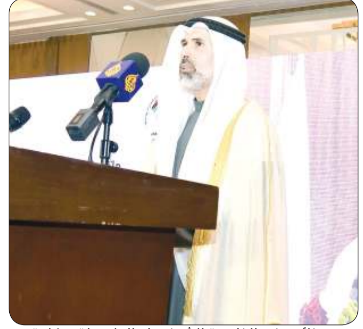
نائب وزير الخارجية الشيخ جراح الجابر يلقي كلمته

وحفظ السلام وبناء السلام ومساعي المصالحة والوساطة وإعادة البناء والتعافي بعد النزاعات. ولفت إلى انه في هذا السياق قامت دولة الكويت مؤخراً بإنشاء اللجنة الوطنية لتنفيذ قرار مجلس الأمن 1325 برئاسة وزارة الخارجية وحماية المرأة عند نشوبها والتأكيد على احتياجاتها ومتطلباتها. وتقديم بتحية احترام وإجلال للنساء في الكويت مستذكراً بكل اعزاز وفخر المرأة الكويتية التي واجهت الاحتلال بكل شجاعة وبسالة وكان لها دور كبير في صفوف المقاومة إذ شاركت بتنظيم الحياة اليومية أثناء الاحتلال وتوفير الاحتياجات الأساسية للسكان وراح ضحية هذه المواقف البطولية العديد من النساء الكويتيات الشهيديات.