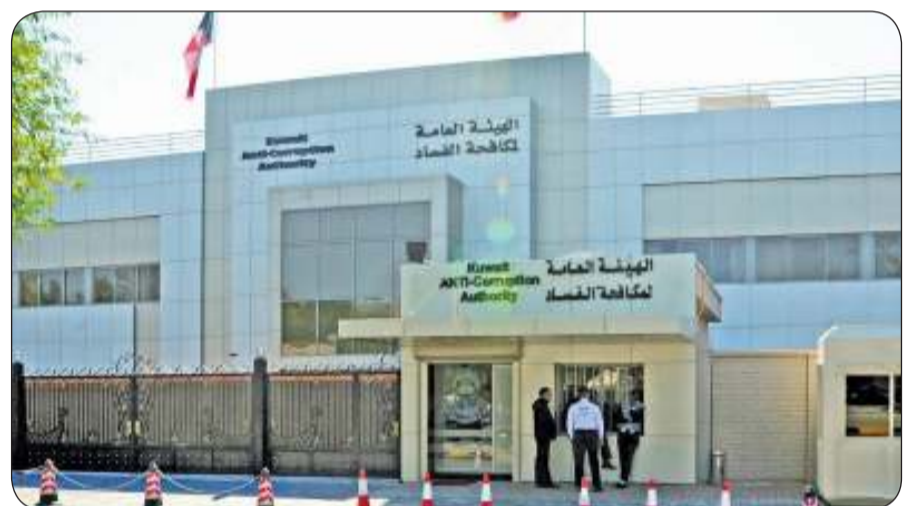
الهيئة العامة لمكافحة الفساد

وأضافت الهيئة أنها لم تسجل بحق أي وزير واقعة تأخير أو امتناع عن تقديم الإقرار خلال المدة القانونية المخصوص عليها من تاريخ مرسوم تولي الوزارة، مشددة على التزامها التام بتطبيق أحكام القانون منذ صدوره وفق مسطرة واحدة، مع إحالتها إلى النيابة العامة كل الخاضعين الذين لم يقدموا الإقرار أو تقدموا به متأخراً بعد فوات المواعيد القانونية بدون استثناء.