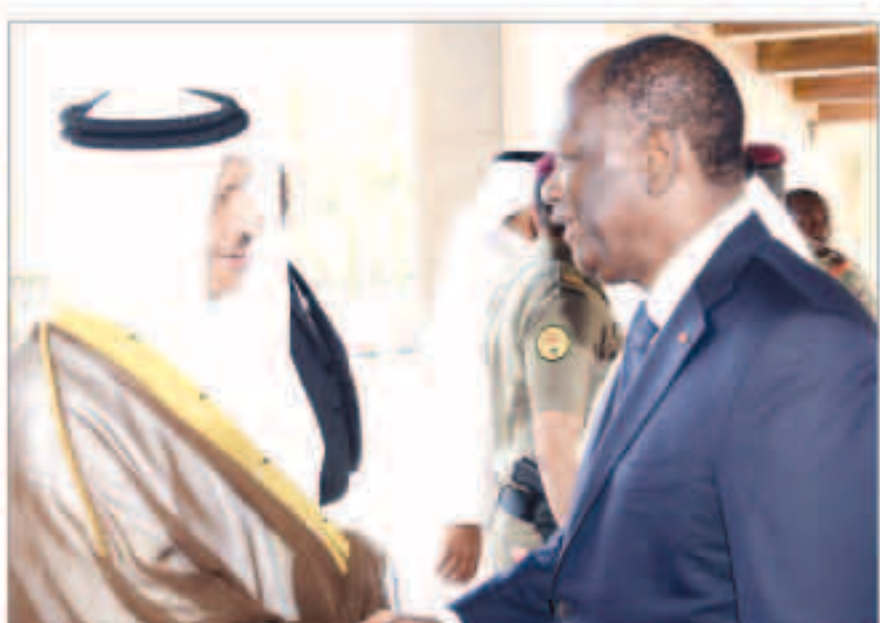
سمو الشيخ جابر المبارك معافحاً الرئيس الحسن وأثارا