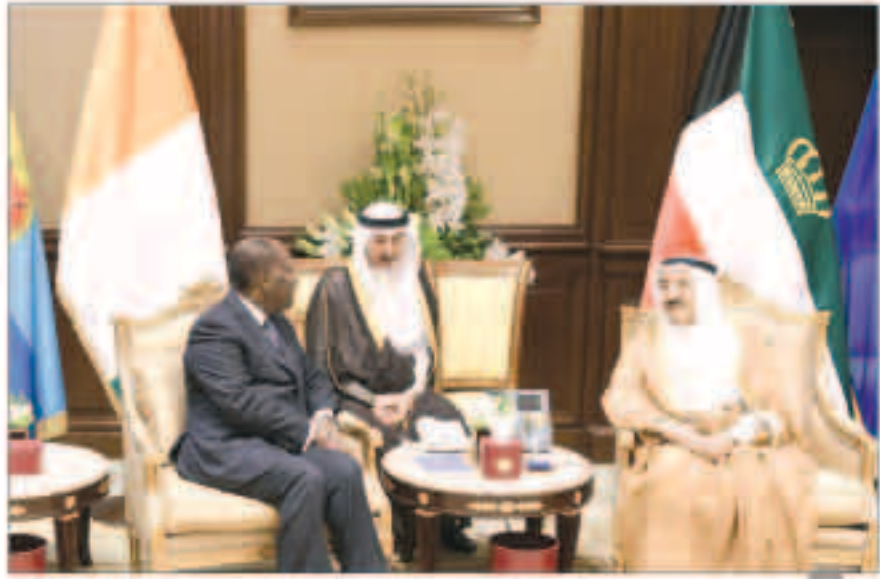
جانب من المباحثات بين سمو أمير البلاد وأثارا