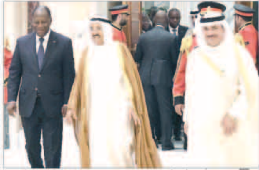
سموه مرحباً بضيفه أثناء مأدبة الغداء

استقبل سمو أمير البلاد الشيخ صباح الأحمد بقصر بيان ظهر أمس الرئيس الحسن وأثارا رئيس جمهورية كوت دي فوار وذلك بمناسبة زيارته الرسمية للبلاد. هذا وقد عقدت المباحثات الرسمية بين الجانبين حيث ترأس الجانب الكويتي صاحب السمو أمير البلاد الشيخ صباح الأحمد وسمو الشيخ جابر المبارك رئيس مجلس الوزراء وكبار المسؤولين بالدولة. وعن جانب جمهورية كوت دي فوار الرئيس الحسن وأثارا وكبار المسؤولين في حكومة