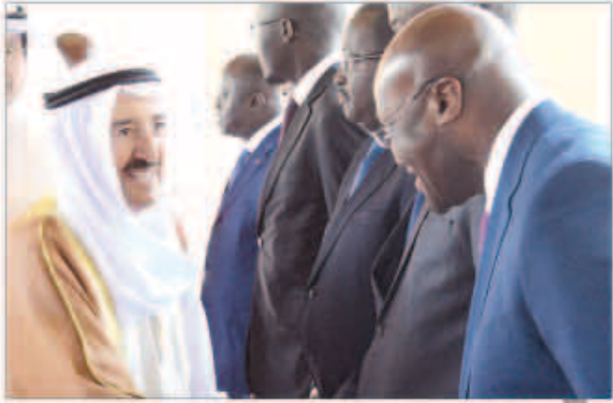
صاحب السمو يستقبل الوفد الإيفواري