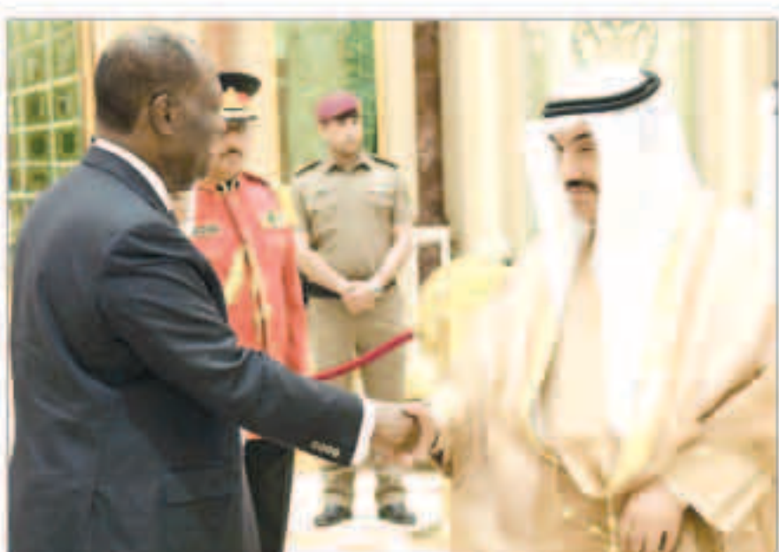
سمو الشيخ ناصر المحمد مرحباً بالرئيس الإيفواري