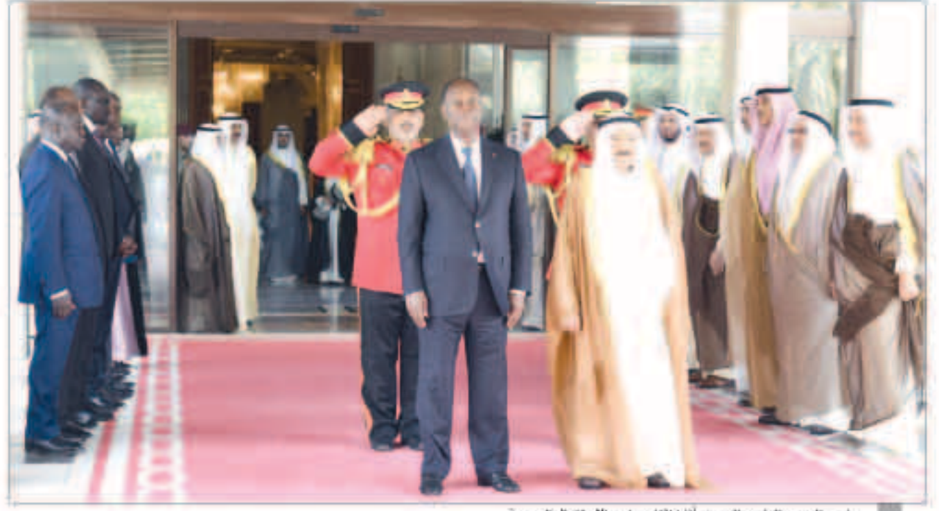
صاحب السمو والرئيس الحسن وأثارا أثناء مراسم الاستقبال الرسمية

جمهورية كوت دي فوار المؤيد لقضايا دولة الكويت خاصة والقضايا الإنسانية عامة. في حين قد فخامته سموه «الوسام الوطني للجدارة» والسدي بعد أعلى وسام في جمهورية كوت ديفوار وذلك تقديراً لدور سموه الرائد في مجال القضايا الإنسانية وإقام صاحب السمو أمير البلاد الشيخ صباح الأحمد بقصر بيان ظهر أمس مادية غداء على شرف الرئيس الحسن وأثارا رئيس جمهورية كوت دي فوار وذلك بمناسبة زيارته الرسمية للبلاد