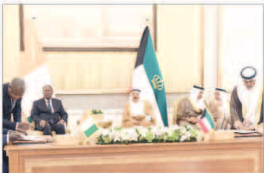
صاحب السمو والرئيس الإيفواري يتبادلان توقيع الاتفاقيات