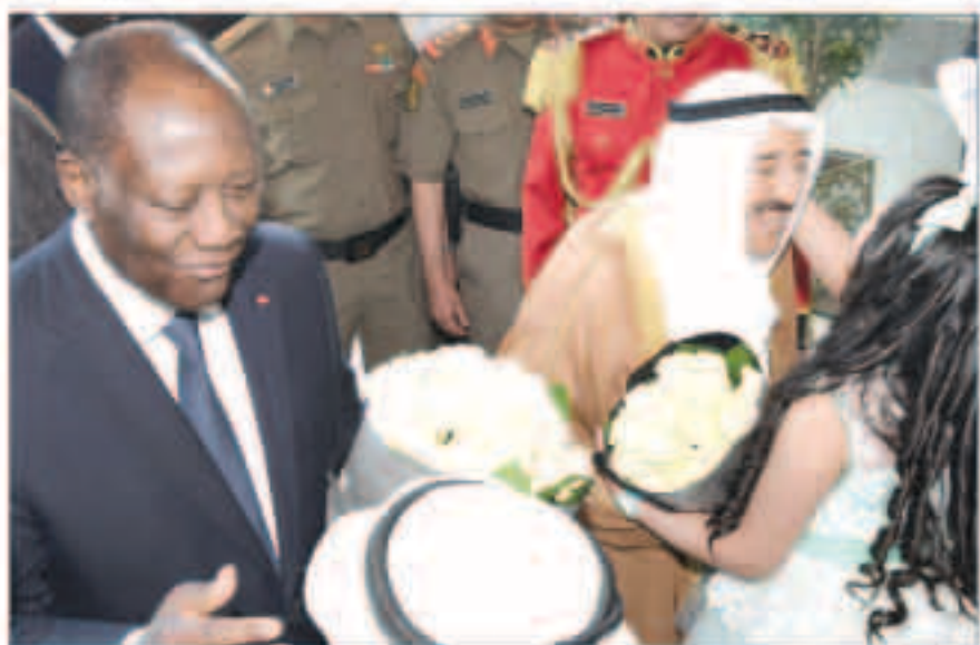
استقبال الشيف باكورد