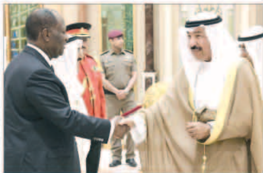
الشيخ جابر العبدالله مرحباً برئيس جمهورية كوت دي فوار