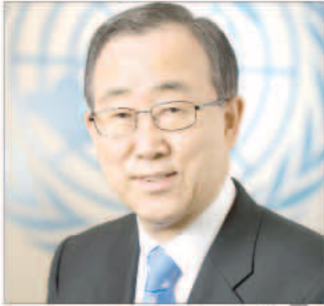
بان كي مون

وانتهاب حقوق الإنسان، شملتهم القرارات الأممية ويجب إخراجهم من المشهد السياسي اليميني منهم مشمولون بالقرارات الأممية، واتخاذ العقوبات اللازمة بحقهم، نتيجة لاستمرارهم في عملية الانتهاكات وإفشال الجهود السياسية في اليمن. وأضاف «علي عبدالله صالح أعطيت له فرصة، وكان من المفترض خروجه من العملية السياسية في السابق، لكنه لم يلتزم بمرجعية المبادرة الخليجية، ومارس دورا يعيق العملية الانتقالية السياسية، وأسهم بشكل كبير إلى جانب عبد الملك الحوثي والقيادات الأخرى بدعم الانقلاب وانتهاج الدولة». وأشار إلى ان تنفيذ العقوبات والقرارات الدولية بحق المبعوثين للعملية السياسية، يشكل أهمية كبيرة للوصول إلى السلام والاستقرار الدائم لليمن.