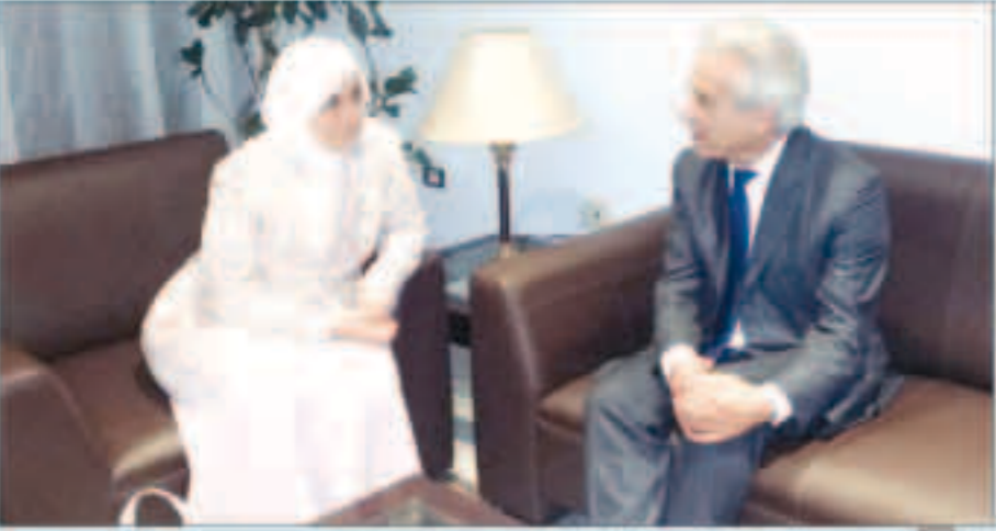
الصبيح خلال لقاءها بتقريرها التونسي

تونس - كونا: أكدت وزيرة الشؤون الاجتماعية والعمل ووزيرة الدولة لشؤون التخطيط والتنمية الكويتية هند الصبيح ان الكويت وتونس تعملان على بناء وتعزيز التعاون المشترك في مجالات الشؤون الاجتماعية والعمل. وقالت الصبيح في تصريح ابلت به «كونا» لدى وصولها إلى تونس مساء أمس الأول في زيارة رسمية تستمر يومين انها ستبحث مع المسؤولين عددا من الموضوعات المتعلقة بالشؤون الاجتماعية وستوقع مذكرة تفاهم لتعزيز التعاون بهذا المجال. وأضافت ان مباحثاتها المجرىة مع وزير الشؤون الاجتماعية التونسي محمود بن رمضان ستخصص لتبادل وجهات النظر بين الجانبين حول الملفات المتعلقة بالتنمية الاجتماعية والقضايا ذات الاحتياجات الخاصة والمسنين والأحداث ومجوهي الوالدين وكل ما يخص الشؤون الاجتماعية. وذكرت انه سيتم في اعقاب هذه المحادثات توقيع مذكرة تفاهم لتعزيز التعاون بين البلدين في هذا المجال تشمل تبادل الخبرات والعمالة والاحتياجات الخاصة وإدماجهم في المجتمعات.