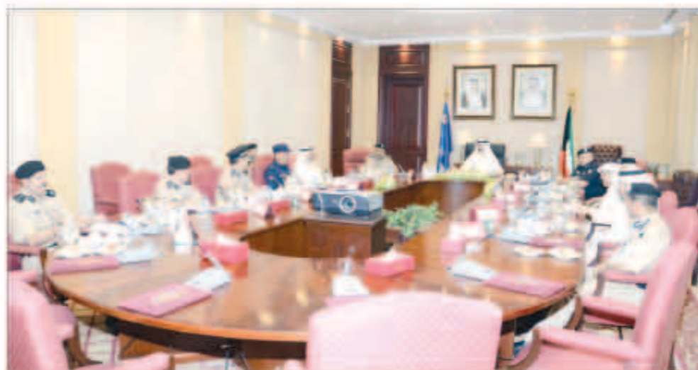
الشيخ محمد الخالد أثناء اجتماعه مع وكلاء الوزارة المساعدين للقطاعات الميدانية

■ التدخل للقضاء على السلبات عند تنفيذ الخطة الأمنية والمرورية المواكبة لعطلة عيد الأضحى