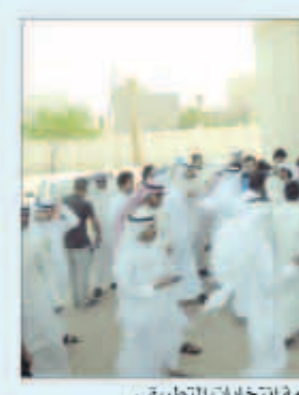
وعود بحماسة المتسببين في أزمة انتخابات التطبيقي

وأضاف الأثري أن ما حصل خلال انتخابات اتحاد طلبة الهيئة العامة للتعليم التطبيقي