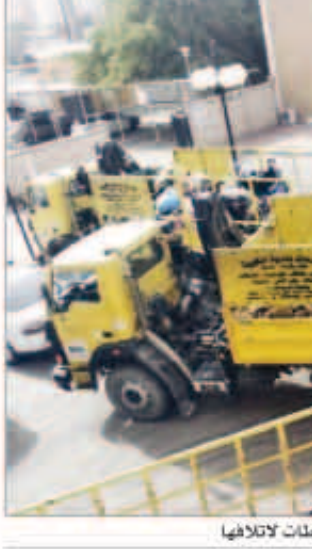
سيارات البلدية تنقل الحبوب والبقوليات

الشرف: تجاوز مؤشر كتلة الجسم 50 يعد سمنة مرضية يصاحبها أمراض القلب أو السكر والضغط