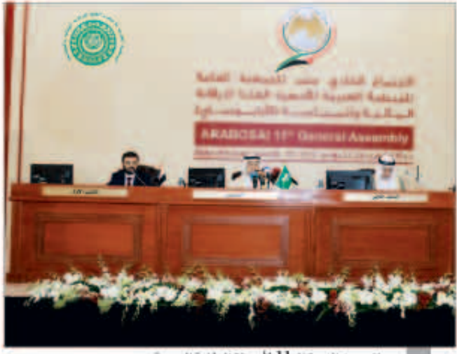
جانب من الدورة الـ11 لأجهزة الرقابة العربية

بن جعفر: دور أجهزة الرقابة ازداد بتنامي الإنفاق العام على متطلبات التنمية