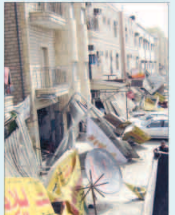
البلدية تواصل حملات النظافة في جميع فروعها

نظمت بلدية الكويت فروعها بالمحافظات بتنفيذ حملات التفتيش التي انطلقت بتوجيهات وزير الكهرباء والماء ووزير الدولة لشؤون البلدية المهندس عبدالعزيز عبداللطيف الإبراهيم تحت شعار «حافظ على نظافة الكويت» الذي يدعو على عدم تشويه المنظر العام والمحافظة عليه وعلى الشوارع والمساحات العامة لدولة الكويت. وفي هذا السياق قام قسم متابعة البعثة التفتيشية وقسم متابعة مخالفات إشغالات الطرق بفرع بلدية محافظة الفروانية بحملة تفتيشية على البعثة المتجولين وبعض المحلات في منطقة جليب الشيوخ. وكانت حصيلة الحملة تحرير عدد «8» مخالفة إشغالات طرق، وعدد «128» مخالفة ببيع متجول، وعدد «9» مخالفة نظافة عامة، وعدد «2» مخالفة قانون 87/9 وقد تم ضبط ومصادره حمولة «3» لوري خضروات وفواكه وحمولة «1» لوري ملابس مستعملة وأيضاً تم ضبط وحجز عدد «3» عربات آيس كريم مخالفة وإرسالهم إلى موقع الحجز في الصفرة.