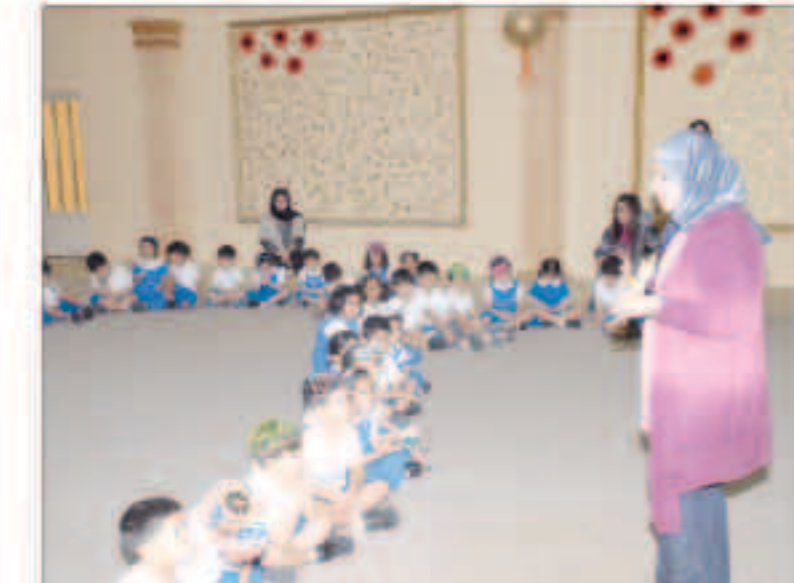
التربية على شريحة الأطفال يأتي من منطلق أنهم مستقبل كل دولة

دشنت بلدية الكويت حملاتها التوعوية في مدارس وزارة التربية ضمن فعاليات الحملة الوطنية «حافظ على نظافة الكويت» التي تنفذها إدارة العلاقات العامة في رياض الأطفال والمرحلة الابتدائية حتى نهاية ديسمبر المقبل، فكانت روضة التوير ومدرسة زكريا محمد الأتصاري الابتدائية في منطقة حولي التعليمية نقطة الانطلاقة لفعاليات الحملة التي شهدت تقديم فقرات توعوية وفلاشات تعني بحب الوطن وأهمية المحافظة على النظافة العامة للمرافق والممتلكات إلى جانب عرض الرسوم المتحركة التي تبين الانعكاسات السلبية لرمي المخلفات العشوائية على البيئة الكويتية والتعريف بما حثنا عليه ديننا الحنيف بأهمية النظافة في حياة الفرد والمجتمع بسان «النظافة من الإيمان».