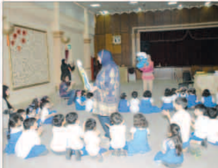
الأطفال يستمعون إلى إحدى الفلاشات التوعوية من المديرات