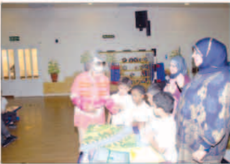
جانب من الفعاليات