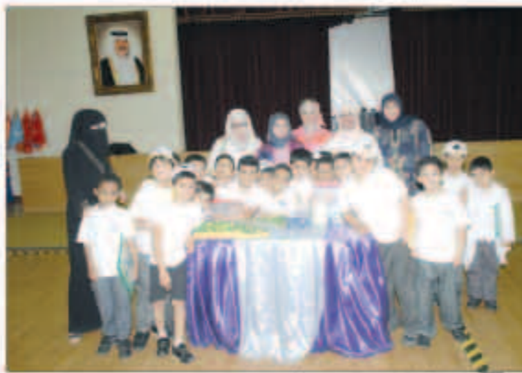
البلدية نفذت الحملات التوعوية في المدارس

في المدرسة كالمحافظة على نظافتها وتجنب رمي القمامة في أروقها وعدم الكتابة على الجدران والحوائط والأبواب.