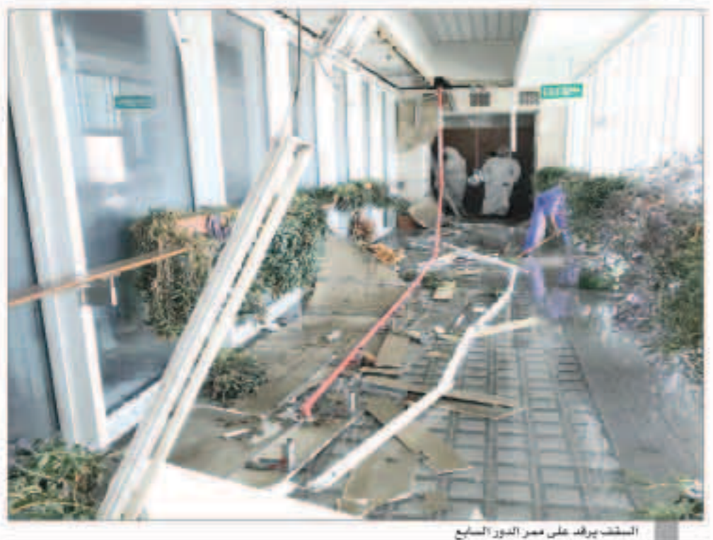
السقف يرفق على عمر الدور السابع

الجسار: جميع موظفي الديوان والمراجعين بخير وتم إخلاء المبنى حفاظاً على سلامتهم