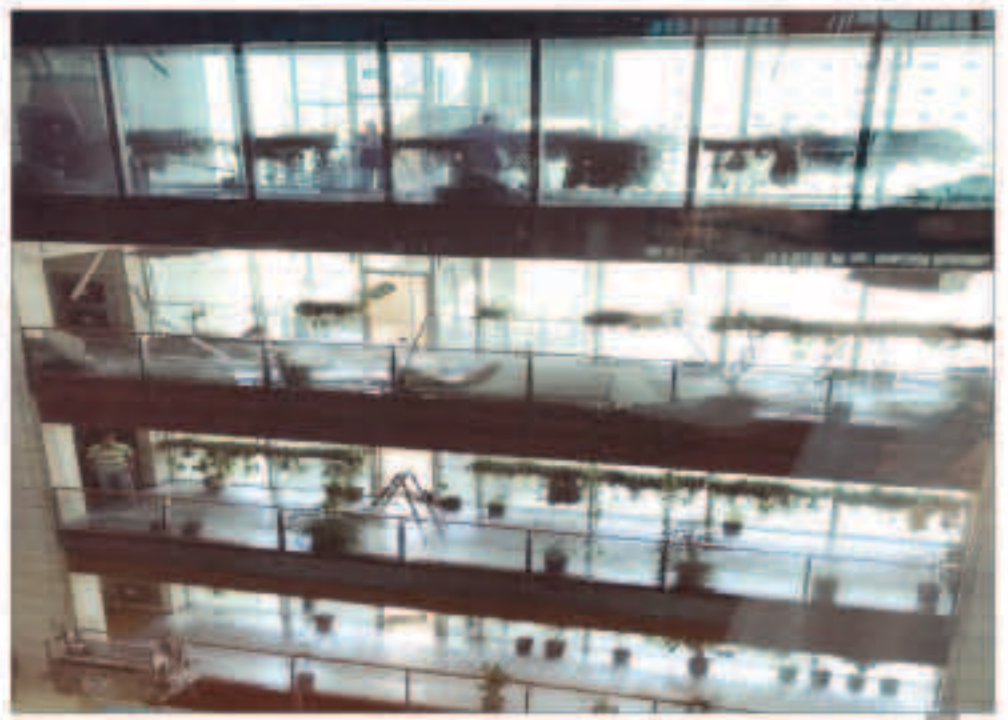
الديوان عقب إخلائه