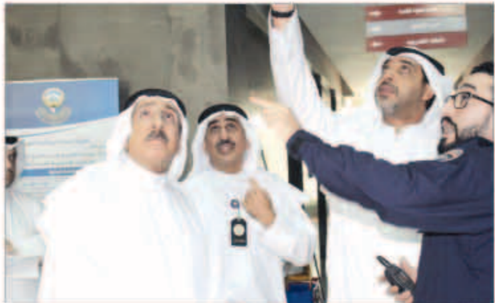
العدالله يتفقد المكان برفقة الجسار ووكيل الديوان