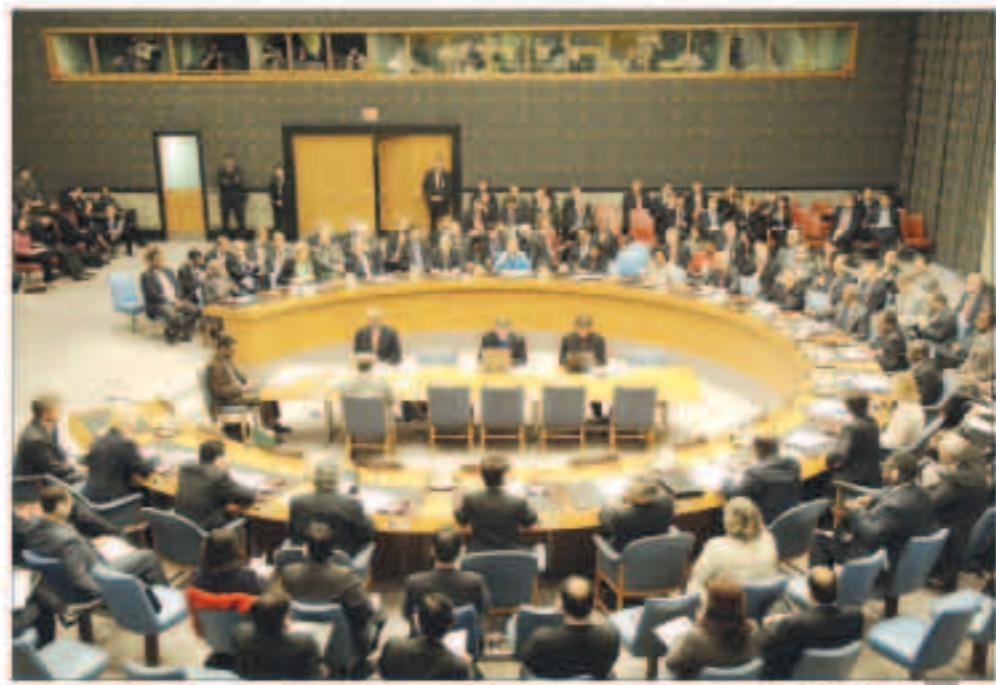
مجلس الأمن الدولي

«التعاون عن كُتب» من خلال الآلية الثلاثية المعنية بملف المفقودين من الكويتيين ووعايا الدول