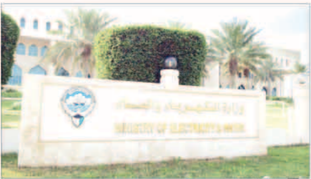
وزارة الكهرباء وتجزئة صيانة جميع محطاتها

■ تجاوب المستهلكين نجح في خفض سقف الزيادة السنوية في الاحمال إلى 4.5 في المئة العام الفائت