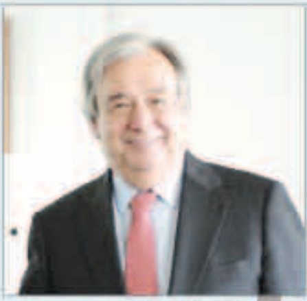
الأمين العام غوتيريس

عن دعم أمريكي كبير لمساعي و جهود الوساطة التي يقوم بها سمو أمير البلاد للتوصل إلى حل سلمي للأزمة الخليجية قائلا «نعم سنؤيد جهود الوساطة هذه مع أمير دولة الكويت».