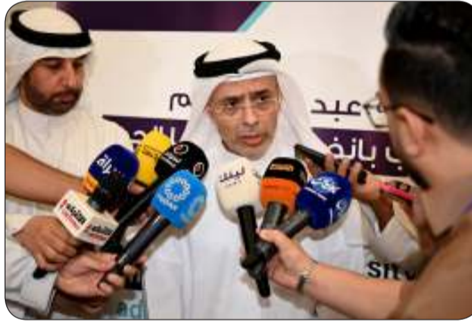
الوزير المانع خلال حديثه لوسائل الإعلام