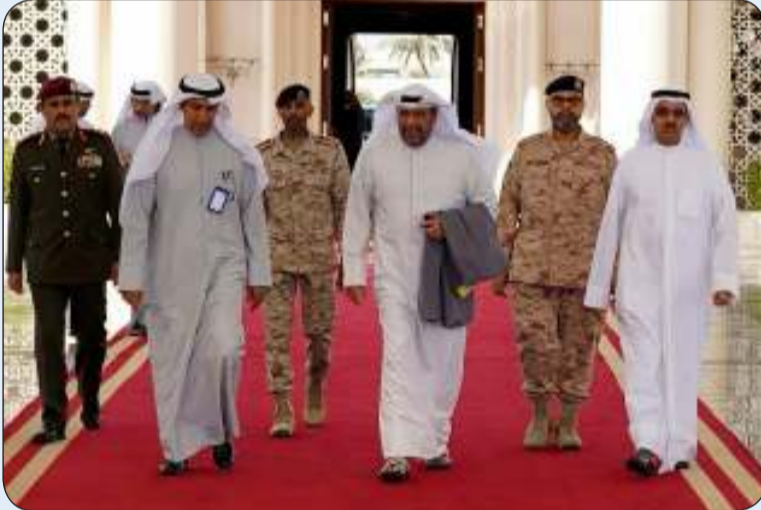
الشيخ أحمد الفهد متوجهاً إلى دولة قطر في زيارة رسمية

غادر نائب رئيس مجلس الوزراء ووزير الدفاع الشيخ أحمد الفهد والوفد الرسمي المرافق له البلاد أمس الثلاثاء متوجهاً إلى دولة قطر الشقيقة في زيارة رسمية.