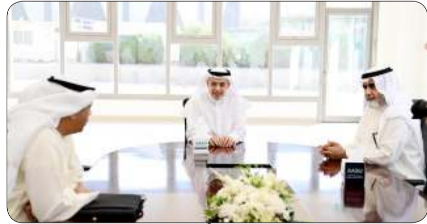
الوزير المانع مجتمعاً بعدد من المسؤولين

وأوضح أن جامعة عبدالله السالم هي البذرة الأولى وإن شاء الله ستعقبها جامعات سوف تقدم مجالات علمية