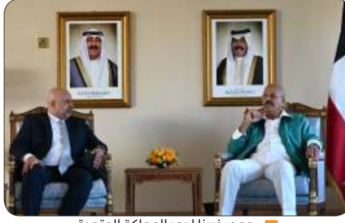
مع سفيرنا لدى المملكة المتحدة