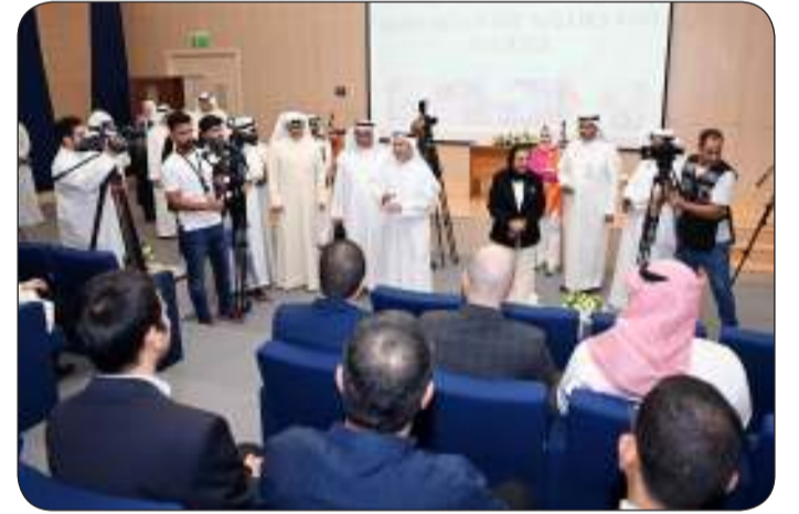
الوزير المانع خلال الجولة