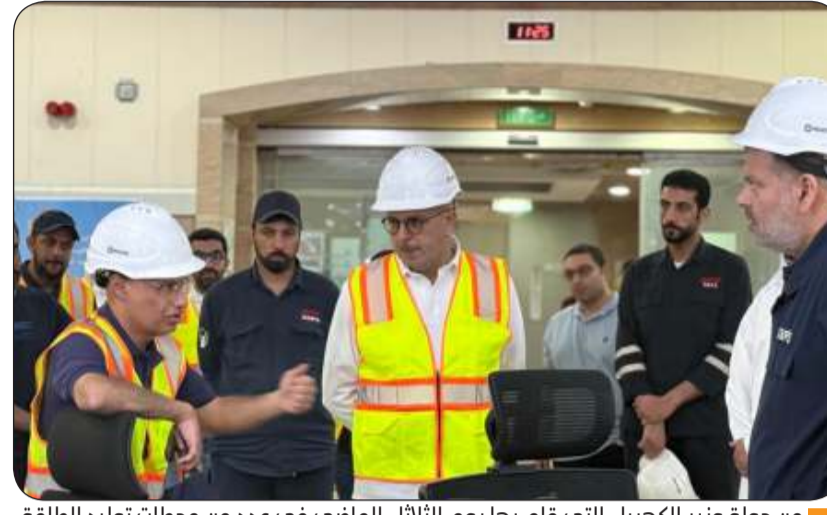
من جولة وزير الكهرباء التي قام بها يوم الثلاثاء الماضي في عدد من محطات توليد الطاقة

«الوزارة»: قد نظرت لفصل التيار عن بعض المناطق لارتفاع الأحمال والصيانة حفاظا على استقرار المنظومة