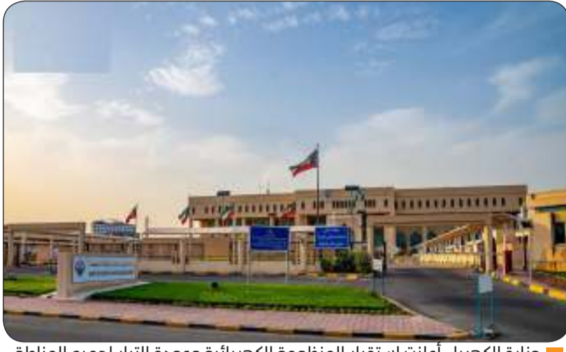
وزارة الكهرباء أعلنت استقرار المنظومة الكهربائية وعودة التيار لجميع المناطق

وحث العاملين على العمل بروح الفريق الواحد لضمان جودة العمل وكفاءة التشغيل واستدامتهما.