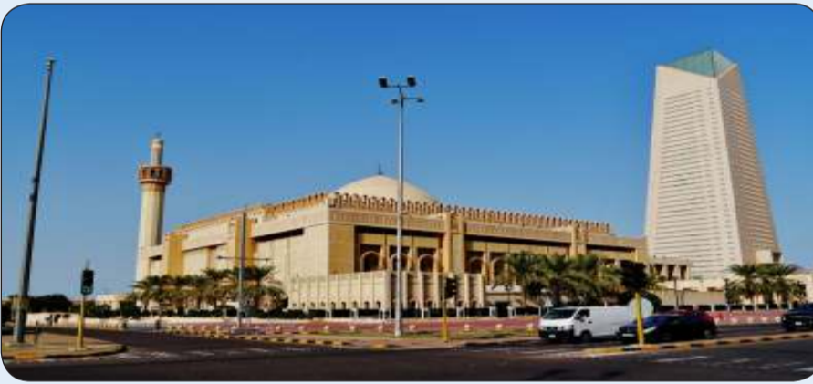
تقليص وقت الإقامة وعدم الإطالة في الصلاة

القطع المبرمج في جميع مساجد المحافظات الست «بيداً القطع المبرمج من اليوم وذلك كالتالي: من بعد أذان الظهر بنص ساعة إلى قبل صلاة العصر بربع ساعة، ومن بعد صلاة العصر بنص ساعة إلى الساعة 5 عصراً، حسب تطبيق مساجد الكويت، منوهاً لجميع الأئمة والمؤذنين بتقليص وقت الإقامة في فرضي الظهر والعصر وعدم الإطالة في الصلاة».