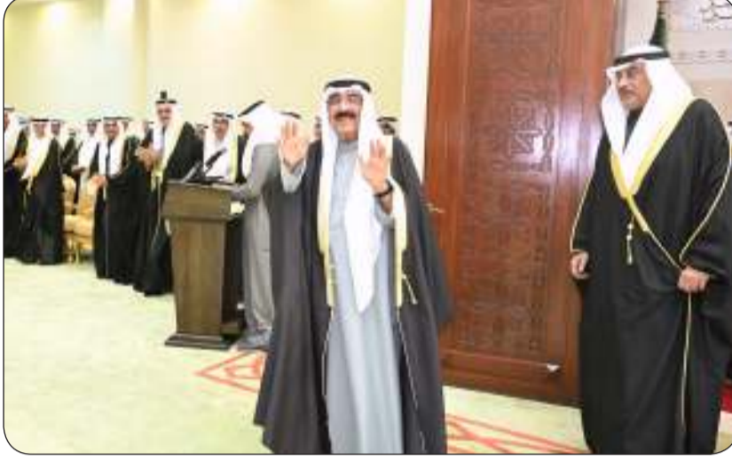
صاحب السمو محبياً الحضور لدى وصوله