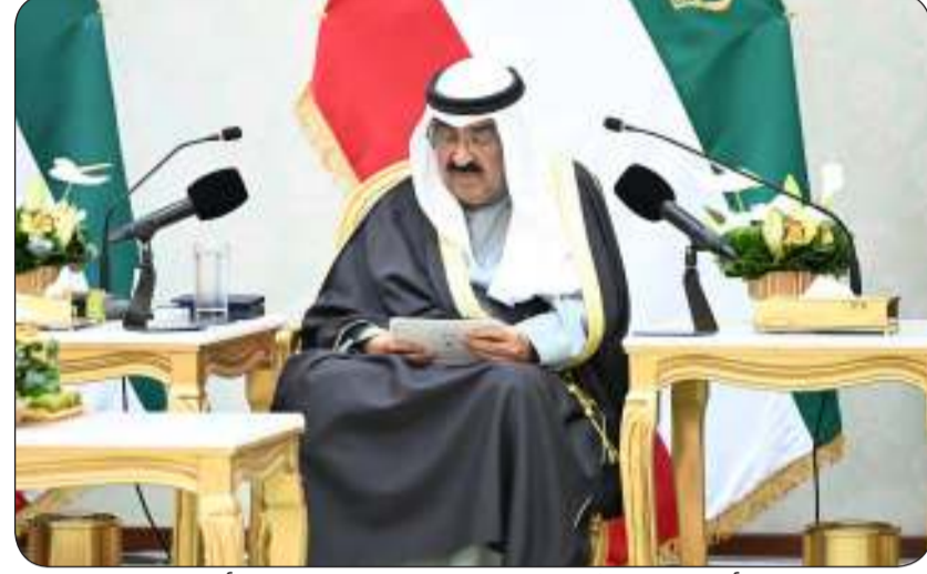
سمو الأمير يلقي كلمته خلال زيارته للمجلس الأعلى للقضاء

القضايا والمسائل المتعلقة بالجنسية من صميم أعمال السيادة