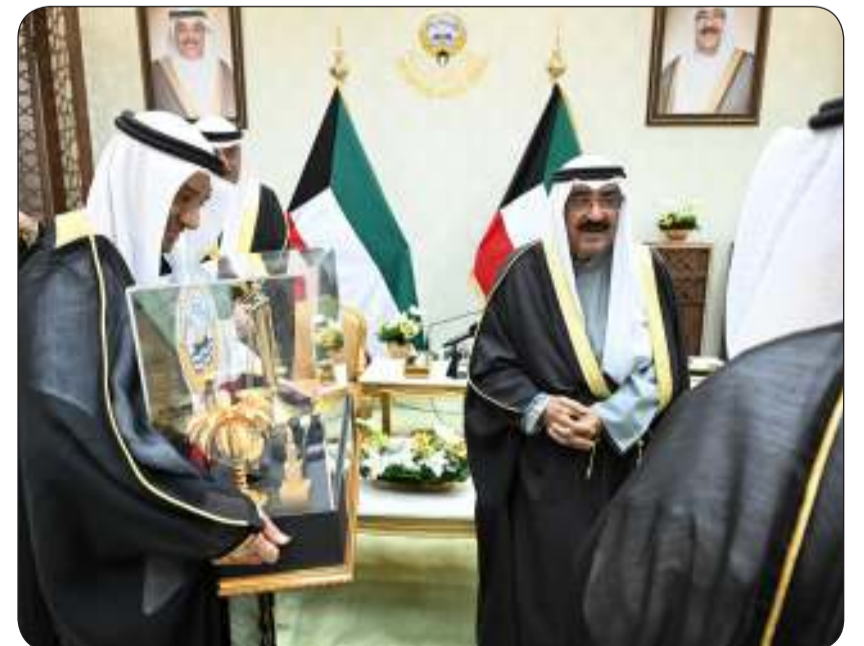
هدية تذكارية لسمو الأمير