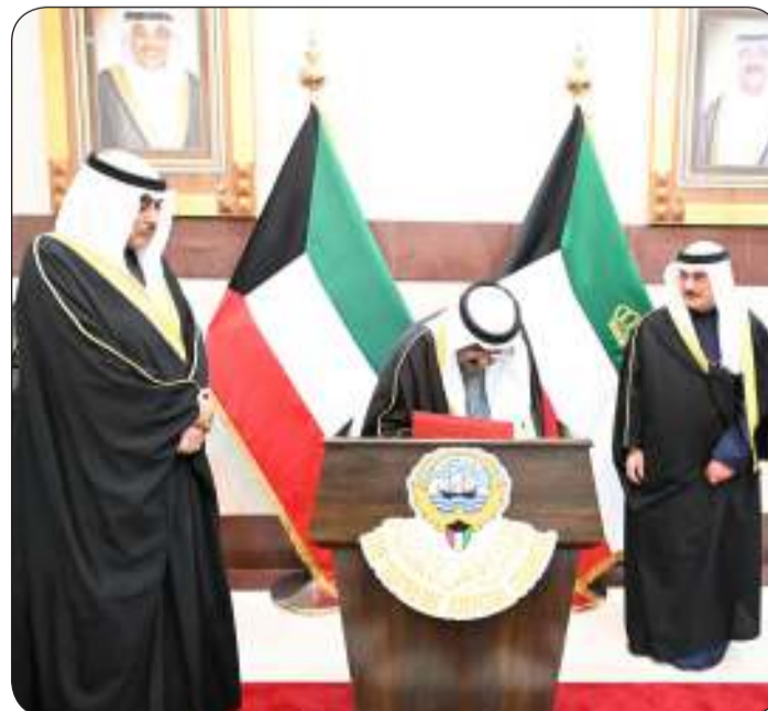
سموه يوقع في سجل الشرف