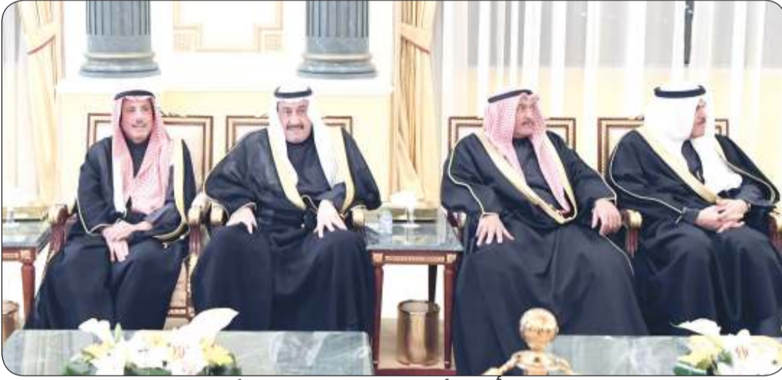
بعض أبناء الأسرة خلال استقبال المهنيين

المناسبات أعادها الله علينا بالخير واليمن والبركات. على صعيد متصل تقدم