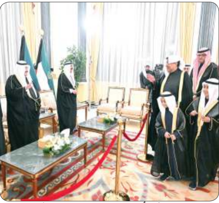
النشء أيضاً حرصوا على تقديم التهنئة