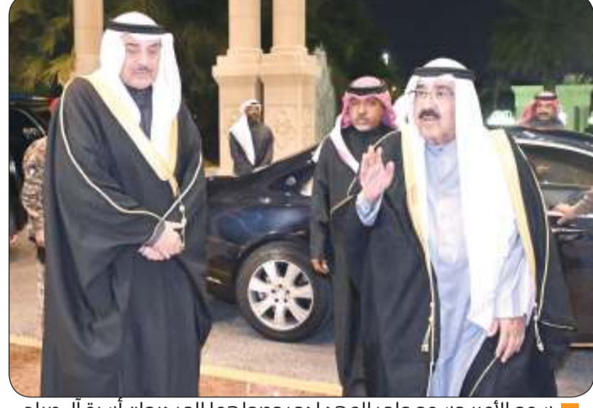
سمو الأمير وسمو ولي العهد لدى وصولهما إلى ديوان أسرة آل صباح

في أجواء تفيض بالود والمحبة استمر توافد المهنيين على ديوان أسرة آل الصباح الكرام بقصر التهنئة سمو أمير البلاد الشيخ مشعل الأحمد، وسمو ولي العهد الشيخ صباح خالد وأسرة آل الصباح الكرام بحلول شهر رمضان المبارك لليوم الثاني على التوالي حيث استقبل رؤساء البعثات الدبلوماسية المعتمدين لدى دولة الكويت وكبار القادة في الجيش والشرطة والحرس الوطني وقوة الإطفاء العام وجموعاً من المواطنين والمقيمين.