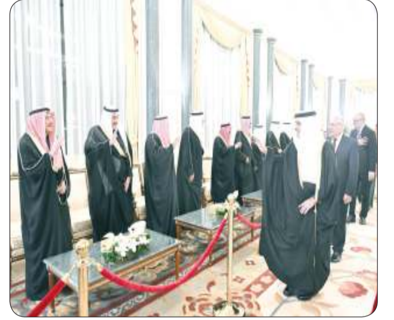
سفراء يقدمون التهاني برمضان