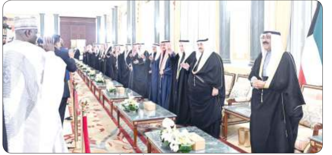
سموه خلال استقبال المهنيين بالشهر الفضيل