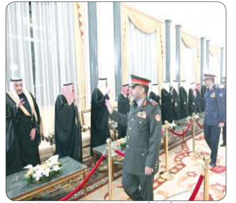
قادة الجيش والشرطة والحرس الوطني قدموا التهاني