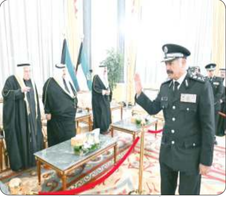
الشيخ سالم النواف مهنتاً برمضان