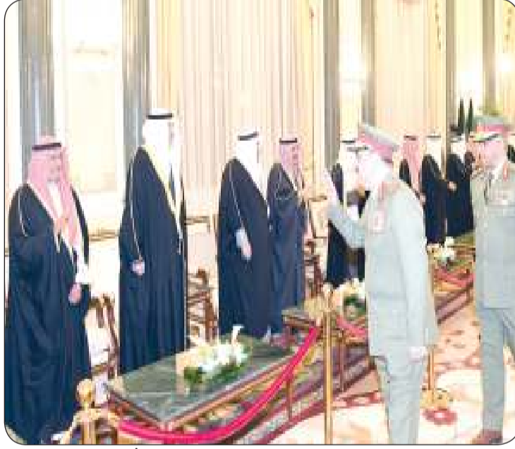
وكيل الحرس الوطني يقدم التهاني بالشهر الفضيل