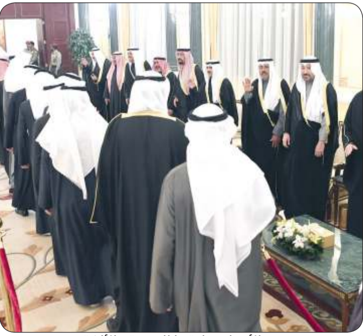
الأجواء سادتها المودة والألفة