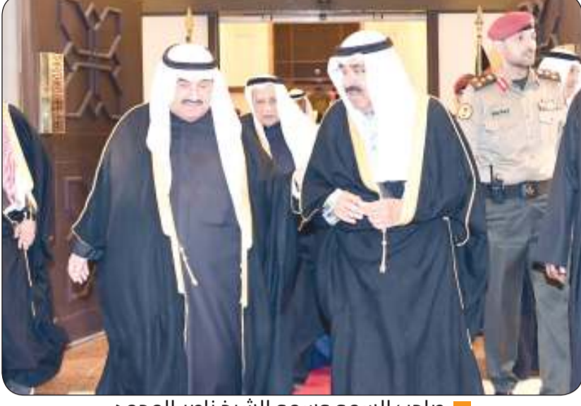
صاحب السمو وسمو الشيخ ناصر المحمد

حفظ الله الكويت وشعبها من كل مكروه وأدام على الجميع نعمة الأمن والأمان في ظل القيادة الحكيمة لحضرة صاحب السمو أمير البلاد وسمو ولي العهد حفظهما الله ورعاهما وكل عام والجميع بخير".