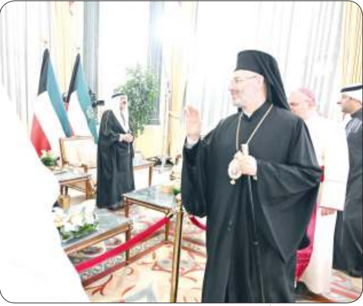
الطوائف الدينية قدمت التهاني بحلول رمضان