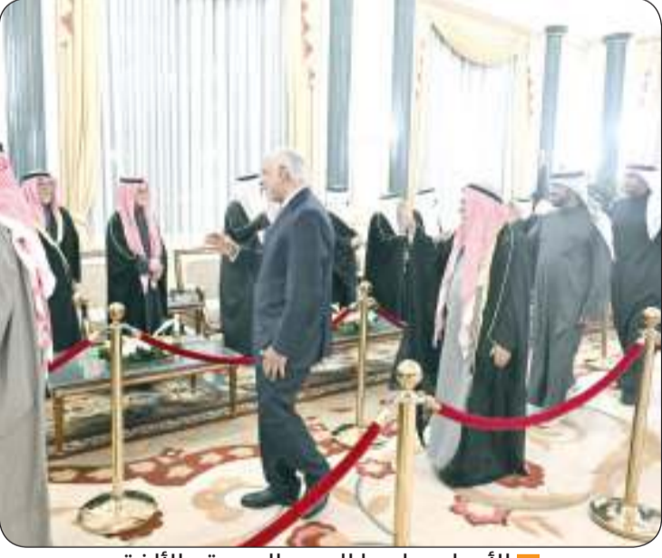
الأجواء سادها الحب والمودة والألفة