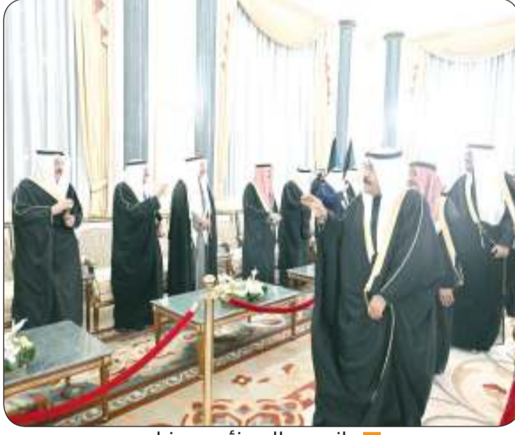
جانب من المهنيين برفضان