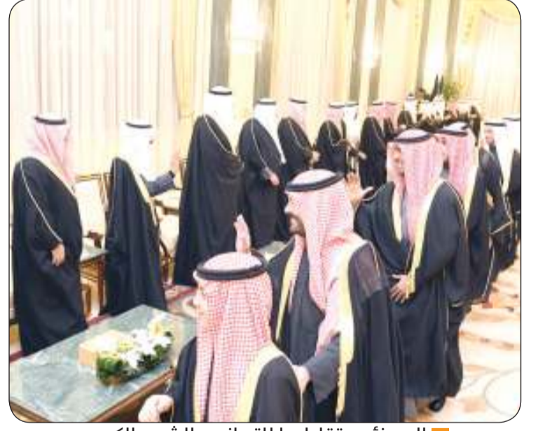
المهنتون تقاطروا للتهاني بالشهر الكريم