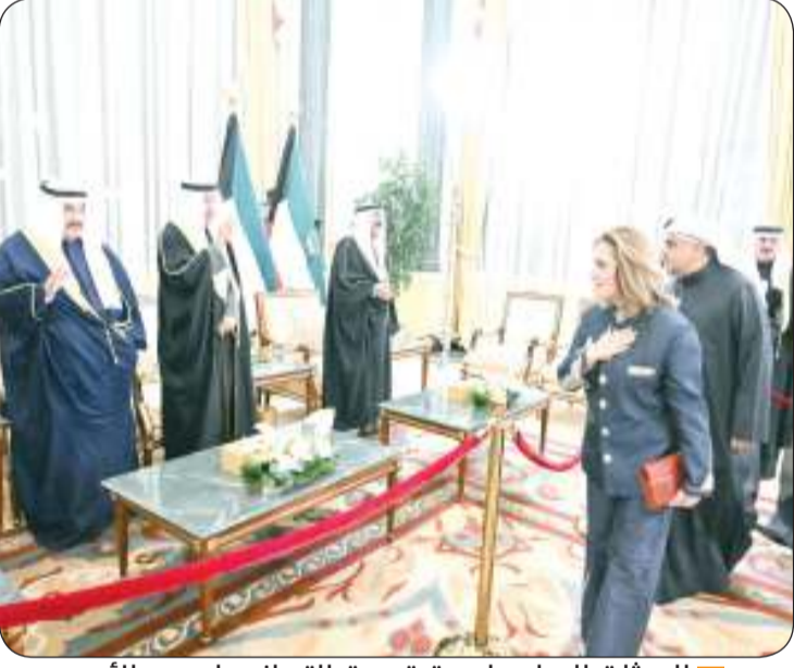
البعثات الدبلوماسية قدمت التهاني لسمو الأمير