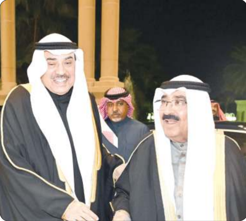
سمو الأمير وسمو ولي العهد لدى وصولهما إلى ديوان أسرة آل صباح