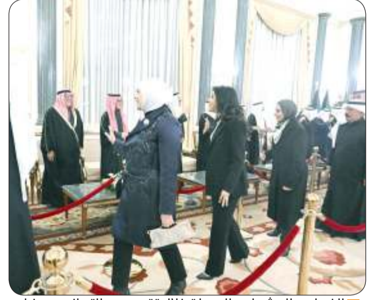
الفصام والمشعان والحويلة خلال تقديمهن التهاني برفضان