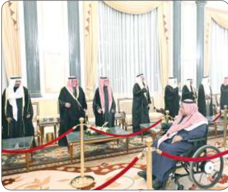
المناسبة جسدت روح الأسرة الواحدة التي تسود المجتمع الكويتي