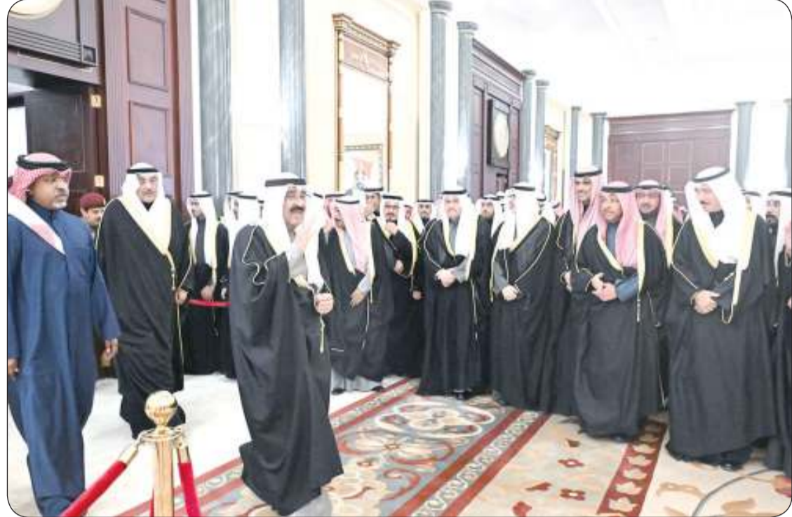
سمو الأمير وسمو ولي العهد وأسرة آل الصباح الكرام يستقبلون جموع المهنيين بشهر رمضان المبارك

بمناسبة حلول شهر رمضان المبارك استقبل سمو أمير البلاد الشيخ مشعل الأحمد وسمو ولي العهد الشيخ صباح الخالد وأسرة آل الصباح الكرام في ديوان أسرة آل الصباح بقصر بيان مساء أول أمس جموع المهنيين بهذا الشهر الفضيل من مواطنين ومقيمين. وقد جسدت ذلك روح الأسرة الواحدة في المجتمع الكويتي الذي جبل على المحبة والمودة وروح الإخاء متمنين أن تعود هذه المناسبة الفضية على الجميع بالخير واليمن والبركات.