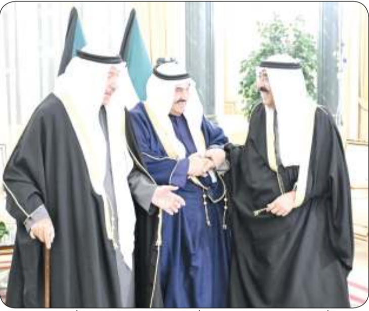
حديث باسم بين صاحب السمو والشيخ جابر العبدالله وسمو الشيخ ناصر المحمد

بمناسبة حلول شهر رمضان المبارك استقبل سمو أمير البلاد الشيخ مشعل الأحمد وسمو ولي العهد الشيخ صباح الخالد وأسرة آل الصباح الكرام في ديوان أسرة آل الصباح بقصر بيان مساء أول أمس جموع المهنيين بهذا الشهر الفضيل من مواطنين ومقيمين. وقد جسدت ذلك روح الأسرة الواحدة في المجتمع الكويتي الذي جبل على المحبة والمودة وروح الإخاء متمنين أن تعود هذه المناسبة الفضية على الجميع بالخير واليمن والبركات.