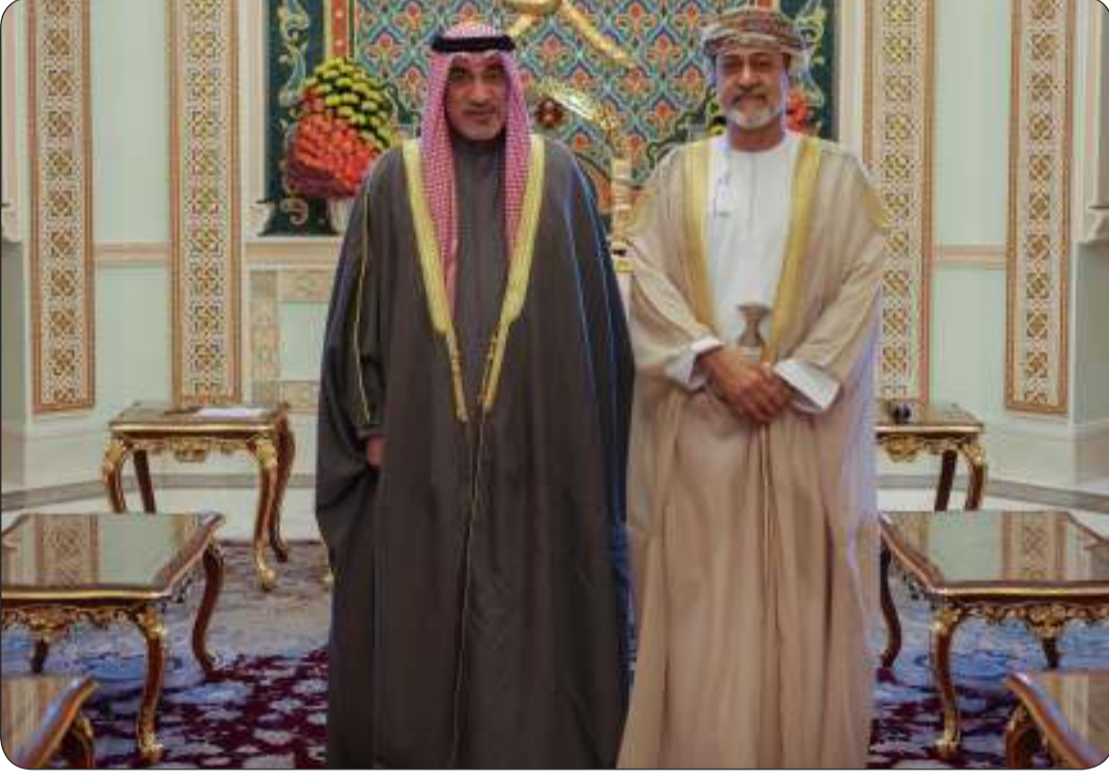
اليوسف نقل تحيات صاحب السمو وولي العهد إلى سلطان عمان

سلطنة عمان. وقالت وزارة الداخلية في بيان صحفي إن النائب الأول لرئيس مجلس الوزراء فهد اليوسف والوفد المرافق له وذلك بمناسبة زيارته الرسمية