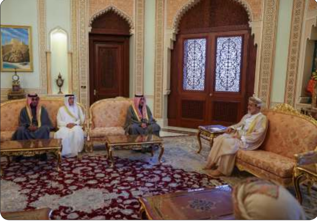
النائب الأول نقل تحيات صاحب السمو وولي العهد إلى سلطان عمان