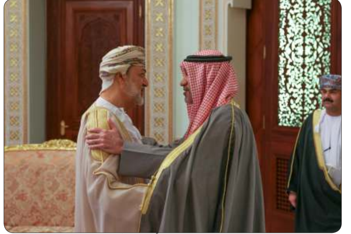
سلطان عمان مرحبا بالنائب الأول

الدكتور محمد ناصر الهاجري. هذا وقد وصل النائب الأول إلى سلطنة عمان الشقيقة أمس وكان في استقباله لدى وصوله نائب رئيس الوزراء لشؤون الدفاع العماني صاحب السمو شهاب بن طارق آل سعيد.