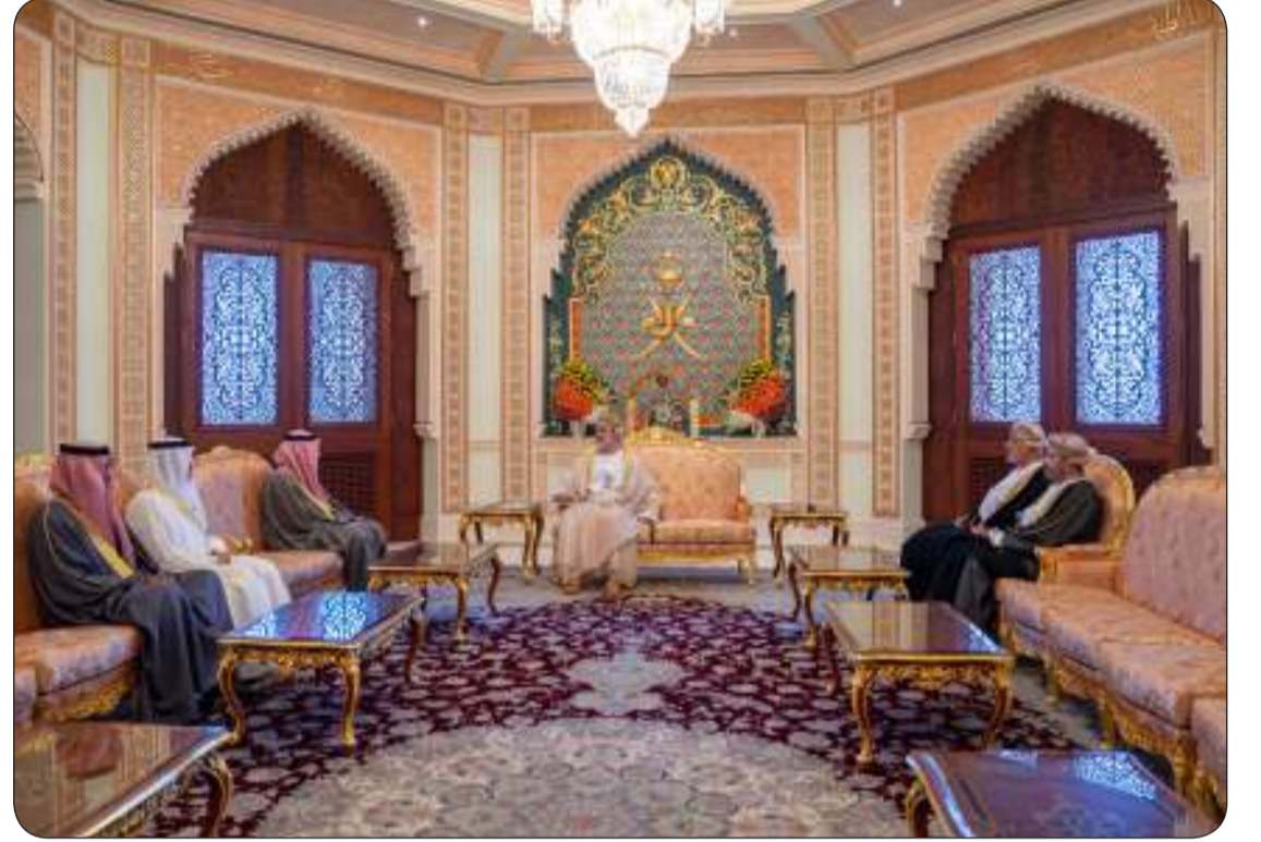
جانب من استقبال سلطان عمان للشيخ فهد اليوسف