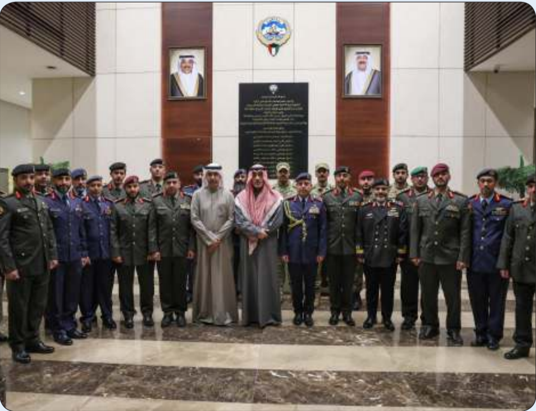
النائب الأول خلال لقائه مع الضباط الكويتيين الدارسين في الكليات العسكرية في الأردن

الأردنية مشيداً بجهودهم واجتهادهم في الحصول على العلوم العسكرية والأكاديمية التي تساهم في تأهيلهم لخدمة وطنهم.