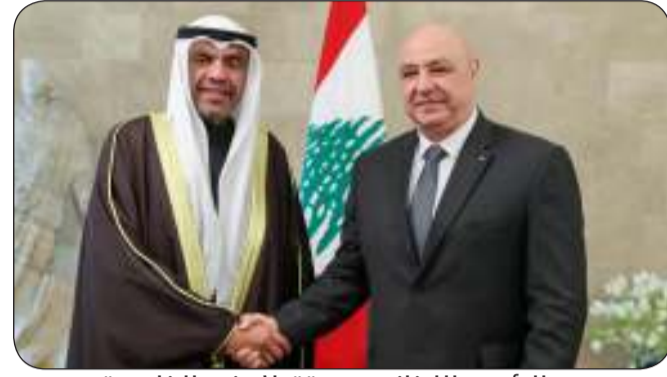
■ الرئيس اللبناني مستقبلا وزير الخارجية

بيروت - "كونا": استقبل رئيس الجمهورية اللبنانية العماد جوزيف عون وزير الخارجية رئيس الدورة الحالية لمجلس الوزراء العربي عبد الله يحيى بجمعية الأمين العام لمجلس التعاون لدول الخليج العربية جاسم البديوي في العاصمة بيروت أمس الأول الجمعة.