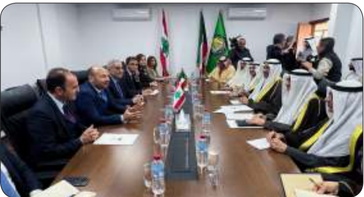
■ وزير الخارجية وأمين مجلس التعاون خلال الاجتماع مع وزير الخارجية اللبناني