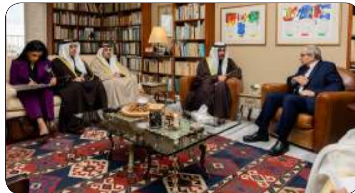
■ الرئيس المكلف بتشكيل الحكومة د. نواف سلام مستقبلا وزير الخارجية وأمين مجلس التعاون