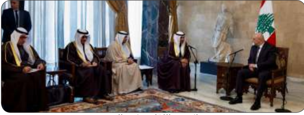
■ جانب من اللقاء بحضور البديوي

وقال البديوي إن دول مجلس التعاون تأمل أن يلبي تشكيل الحكومة اللبنانية الجديدة "المرتقبة" طموحات الشعب اللبناني متمنيا للبنان وحكومته التوفيق في المرحلة المقبلة. وأعرب عن سعادته لما سمعه من القيادة السياسية في لبنان من تأكيد على عزمها نحو المضي قدما تجاه تنفيذ الإصلاحات المطلوبة والموصى بها دوليا بما يضمن خير وصلاح الشعب اللبناني على المستويات كافة. واعتبر أن الإصلاحات التي وعد بتنفيذها الرئيس اللبناني نعد "الطريق الصحيح نحو النهوض بلبنان" مشددا على مواقف دول الخليج التاريخية الثابتة تجاه دعم لبنان ومساندته. كما نقل تهنئة دول مجلس التعاون لسدول الخليج العربية للشعب اللبناني الشقيق بمناسبة انتخاب البرلمان للعماد جوزيف عون رئيسا للجمهورية وحيازته على هذه الثقة معربا عن الأمل بأن يسهم انتخابه في استعادة الأمن والسلام من جهته أكد الأمين العام لمجلس التعاون جاسم البديوي دعم دول المجلس للجمهورية اللبنانية لكل ما من شأنه أن يعزز أمنها واستقرارها ويسهم في الازدهار والتنمية المستدامة للشعب اللبناني الشقيق.