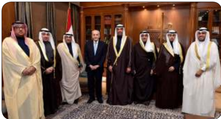
■ رئيس مجلس النواب نبيه بري مستقبلا يحيى والبديوي والوفد المرافق