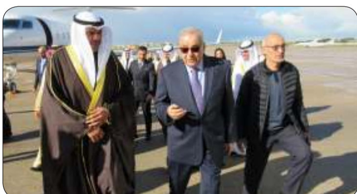
■ وزير الخارجية اللبناني مستقبلا يحيى والبديوي