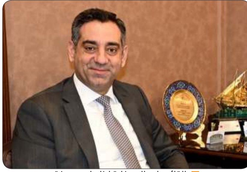
القائم بأعمال سفارة لبنان احمد عرفة

اللبنانية أوائل ديسمبر الماضي. وعلى صعيد مجلس التعاون الخليجي، فتتقاطع الوفود الوزارية والدبلوماسية على لبنان باستمرار، وقد سبقت زيارة الوزير اليحيا غداً الى بيروت، اعلان وزير