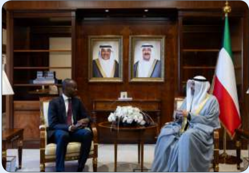
ومستقبلاً سفير رواندا

وتمنى الوزير للسفير الجديد التوفيق في مهام عمله وللعلاقات الثنائية الوثيقة التي تجمع البلدين الصديقين، الذي تم في ديوان عام