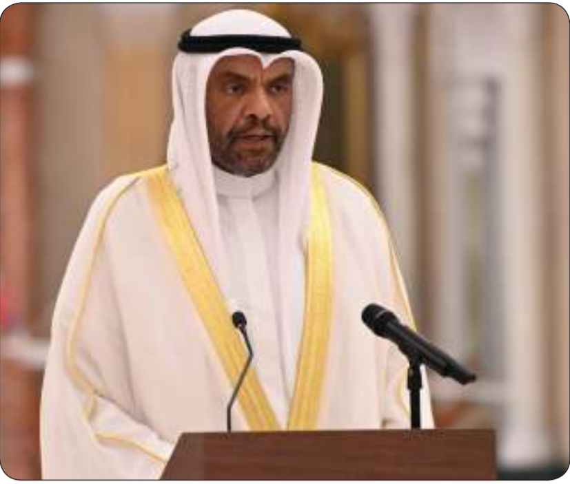
وزير الخارجية عبدالله الجبير

تأكيداً لما انفردت به الصباح .. يرافقه أمين مجلس " التعاون " على رأس وفد رفيع المستوى