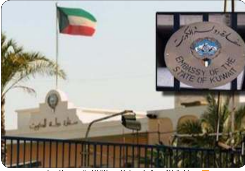
سفارة الكويت في لبنان بانتظار تعيين السفير

ونوه المجلس الوزاري بالمساعدات السخية المقدمة من دول مجلس التعاون إلى الشعب اللبناني الشقيق، وبما قدمته الدول الشقيقة والصديقة، لتلبية الاحتياجات الإنسانية الطارئة في لبنان.