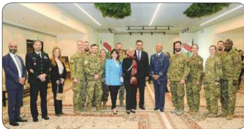
جانب آخر من الحضور

وقالت : انخرطت السفيرة اللبنانية ضمن مجلس تعزيز الفرانكفونية في الكويت المؤلف من مختلف سفارات الدول الناطقة باللغة الفرنسية، ومشاركتها في مختلف النشاطات والفعاليات، نعيد تأكيد التزامنا كبلدانيين بقيمتنا المشتركة مع جميع هذه الدول من السلام والديمقراطية واحترام حقوق الإنسان والنضام والحوار والتسامح غيرها. ونعبر أيضاً عن عزمنا وإصرارنا على بناء معا فرانكوفونية المستقبل وبذل الجهد اللازم من أجل الارتقاء بها نحو آفاق أرحب في الكويت والعالم.