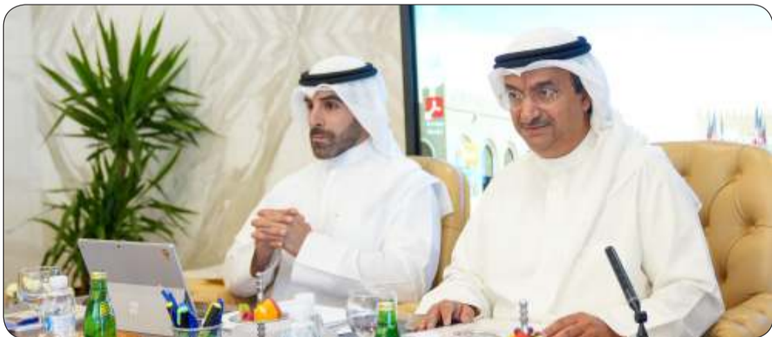
الأمانة العامة تتابع مجريات الجلسة