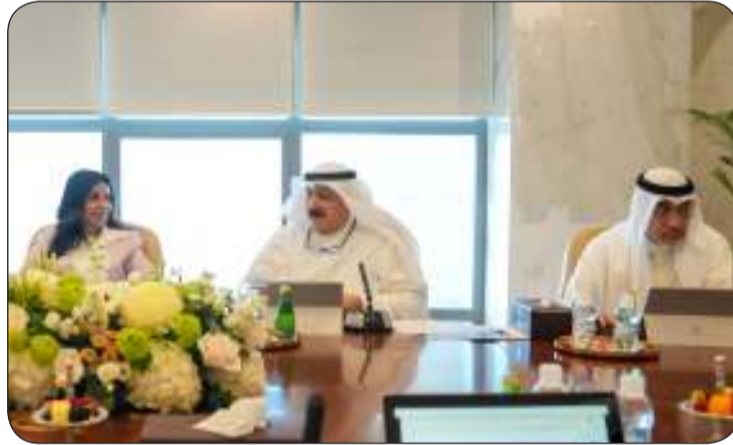
اليوسف والعوضي والمشعان خلال الاجتماع