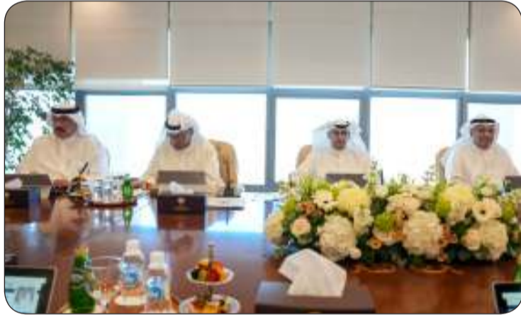
العمر والمشاري والجلال وجلال الطبطبائي