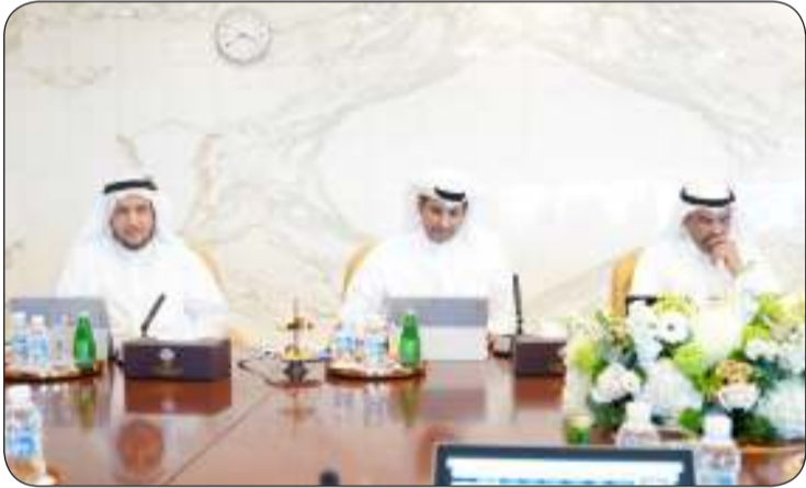
اليحيا والمطيري والمعوشي

التوفيق والسداد في أداء مهامهما ودعا سمو الشيخ أحمد عبدالله الأحمد الصباح رئيس مجلس الوزراء إلى ضرورة مضاعفة الجهود والعطاء والتعاون في البلاد وتحقيق طموحات المواطنين. من جهة أخرى استمع مجلس الوزراء إلى شرح وزير الصحة الدكتور أحمد عبدالوهاب العوضي بشأن كافة التفاصيل المتعلقة بمستشفى الولادة الجديد الذي يعد أحد أكبر مستشفيات الولادة في المنطقة عربياً عن خالص