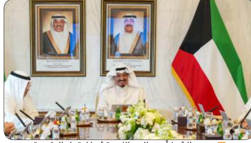
سمو الشيخ أحمد العبدالله مترئسا اجتماع الحكومة

عقد مجلس الوزراء اجتماعه الأسبوعي أمس الأول الثلاثاء في مبنى معهد الكويت للاختصاصات الطبية برئاسة سمو الشيخ أحمد العبدالله رئيس مجلس الوزراء.