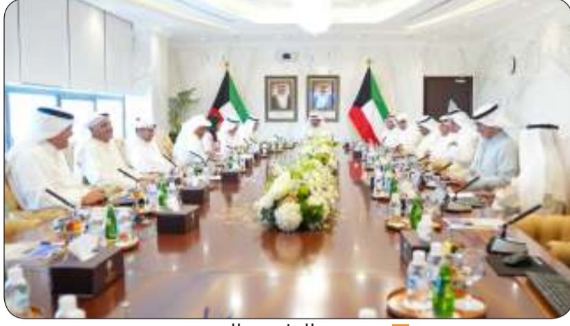
ويرحب بالوزيرين الجديدين

كما أكد مجلس الوزراء على ضرورة إيجاد الآليات المناسبة لتجنيب البلاد أية مشاكل قد تؤدي إلى انقطاع التيار الكهربائي خلال موسم الصيف القادم وذلك في ظل التحديات الكبيرة التي تواجهها الدولة والمرتبطة بزيادة معدلات الطلب على الطاقة الكهربائية.